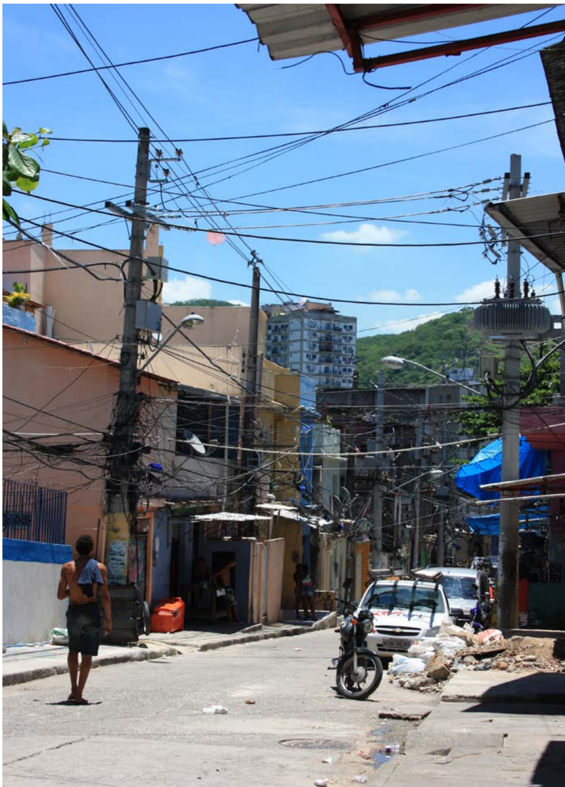
Längst ner i favelan Mangueira hänger elkablarna kors och tvärs, trottoarkanten är full av sprickor och många av husen ser fallfärdiga ut.