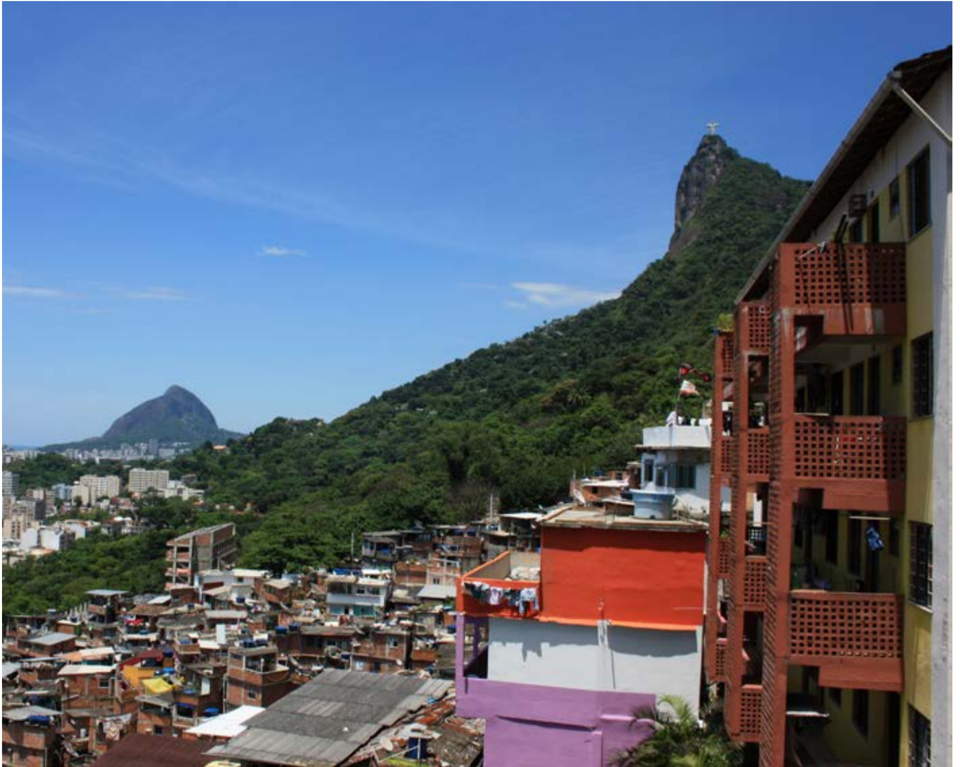
Rio de Janeiros landmärke, Jesusstatyn, syns från favelan Santa Marta. Utsikten vittnar om två olika världar som geografiskt ligger ett stenkast ifrån varandra. Den ena visar fallfärdiga hus som ser ut att vara byggda ovanpå varandra, den andra om vita höghus med strandutsikt i den rika stadsdelen Botafogo.