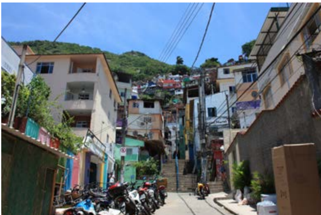
Längst ner i favelan Santa Marta står flera moto-taxis och väntar. Innan spårvagnen infördes fick de boende antingen gå upp för de cirka 800 trappstegen eller åka moto-táxi för att komma hem.