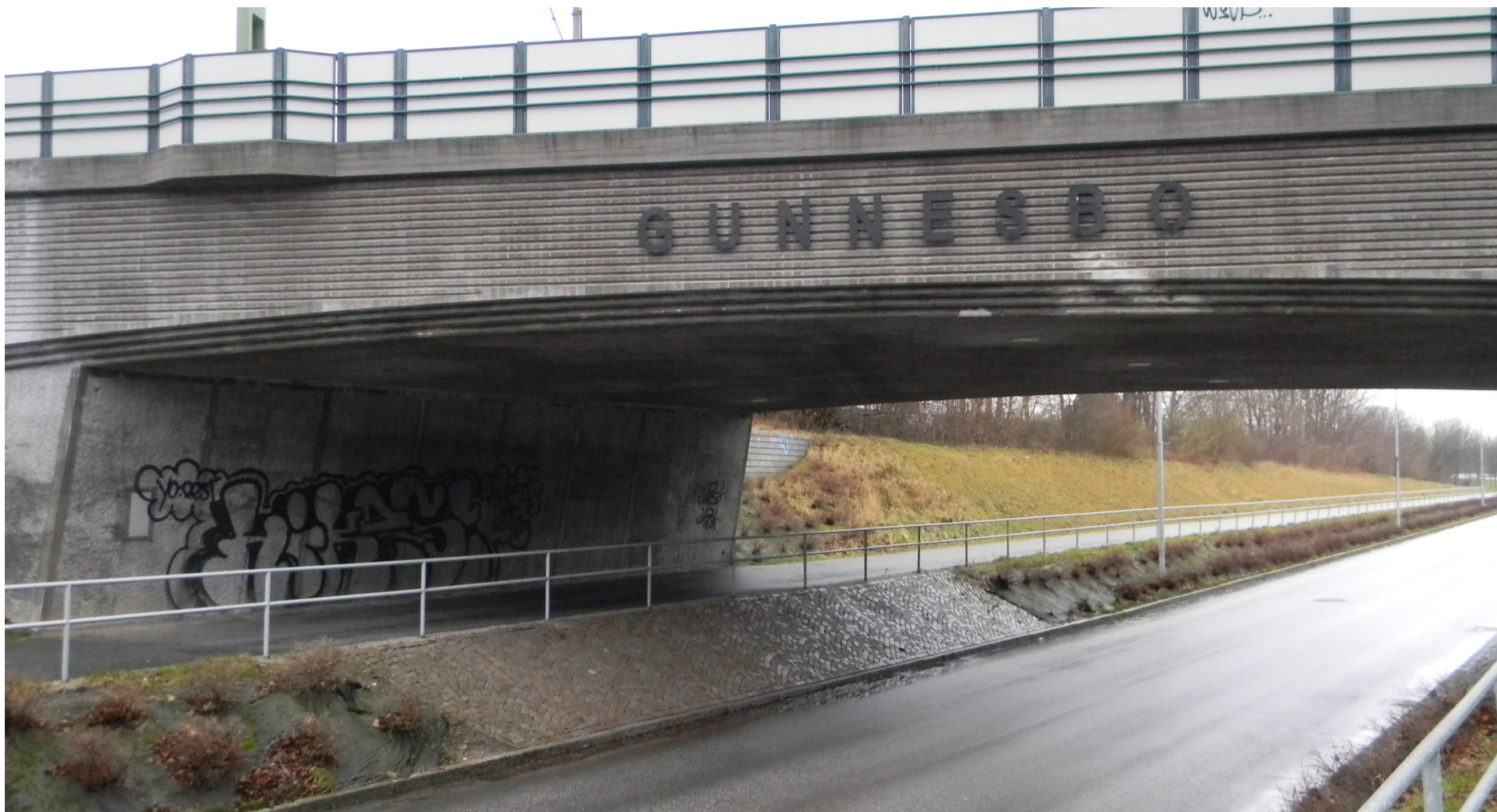
Går du till Gunnesbo från Nöbbelöv välkomnas du av bron som bär tåget mot Lund. Trots att resan till centrala Lund tar ungefär två minuter är det förvånansvärt många unga som håller sig på Gunnesbo.

som han säger: "Hall och hall, det är fyra väggar i alla fall".