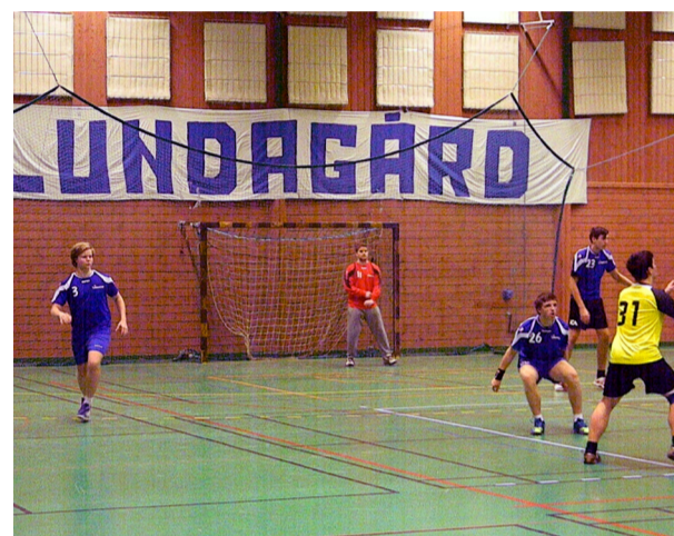
Hemmalaget Lundagård har en del bekymmer med IFK Malmö HKs längre spelare men efter en timeout med under minuten kvar lyckas de klara ett oavgjort resultat.

såg upp till dem och ville bli lika bra som dem, säger Ebba Engdahl, född 1991.