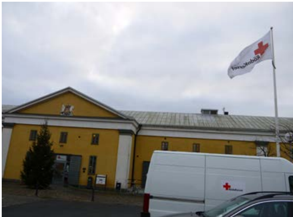
Röda Korsets Mötesplats Kupan har sin lokal i ett av Kristianstads gamla kasernhus.

olika sätt med verksamheten. Runt 15 personer hjälper till en vanlig dag: frivilliga, praktikanter och personer med någon form av anställning.