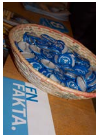
Kristianstads FN-förening startade 1977.