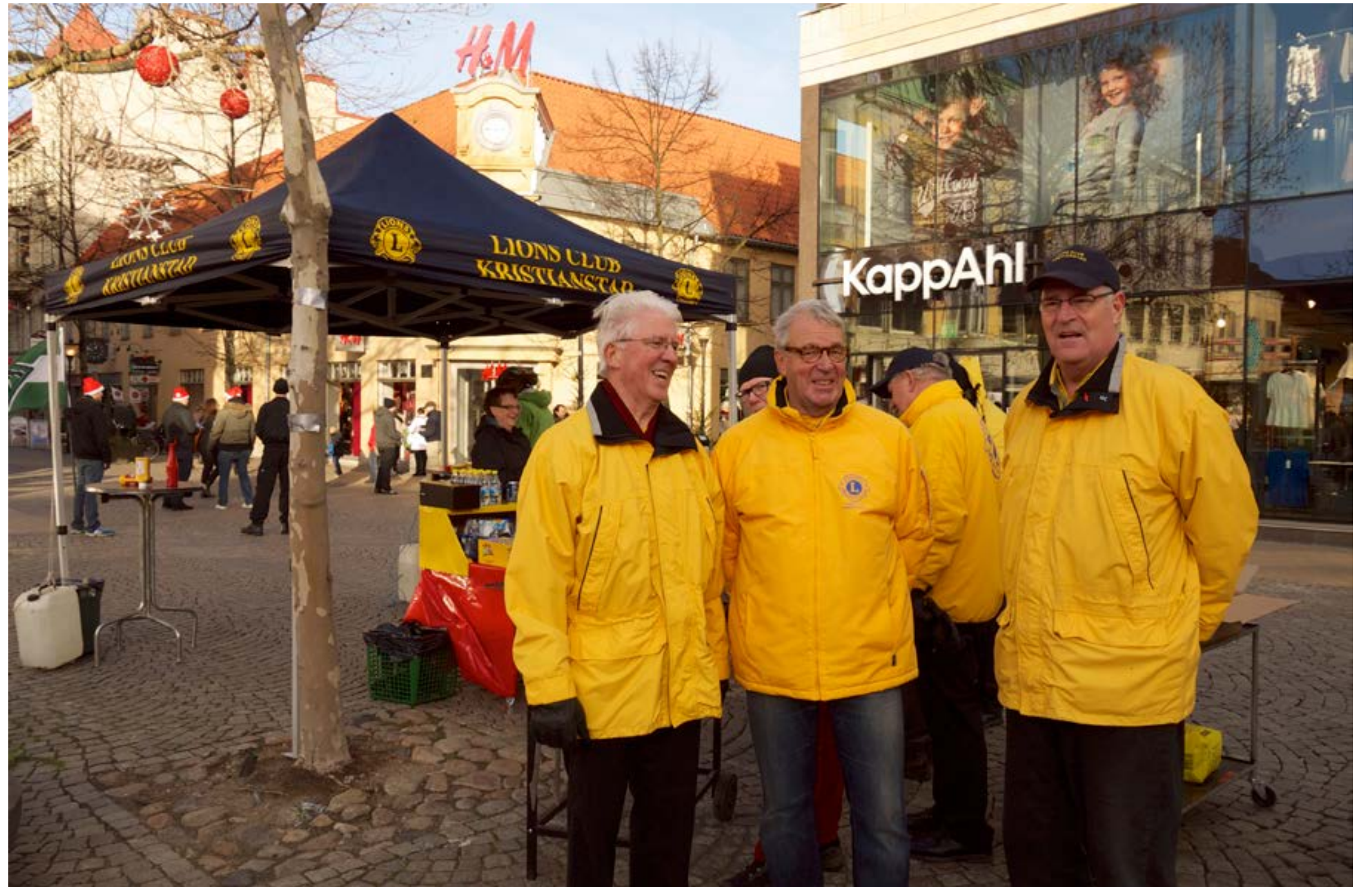
Lions. En av de insamlingsaktiviteter som Lions i Kristianstads klubblokal ligger mitt i centrala Kristianstad, med sittplats för alla de 36 medlemmarna.