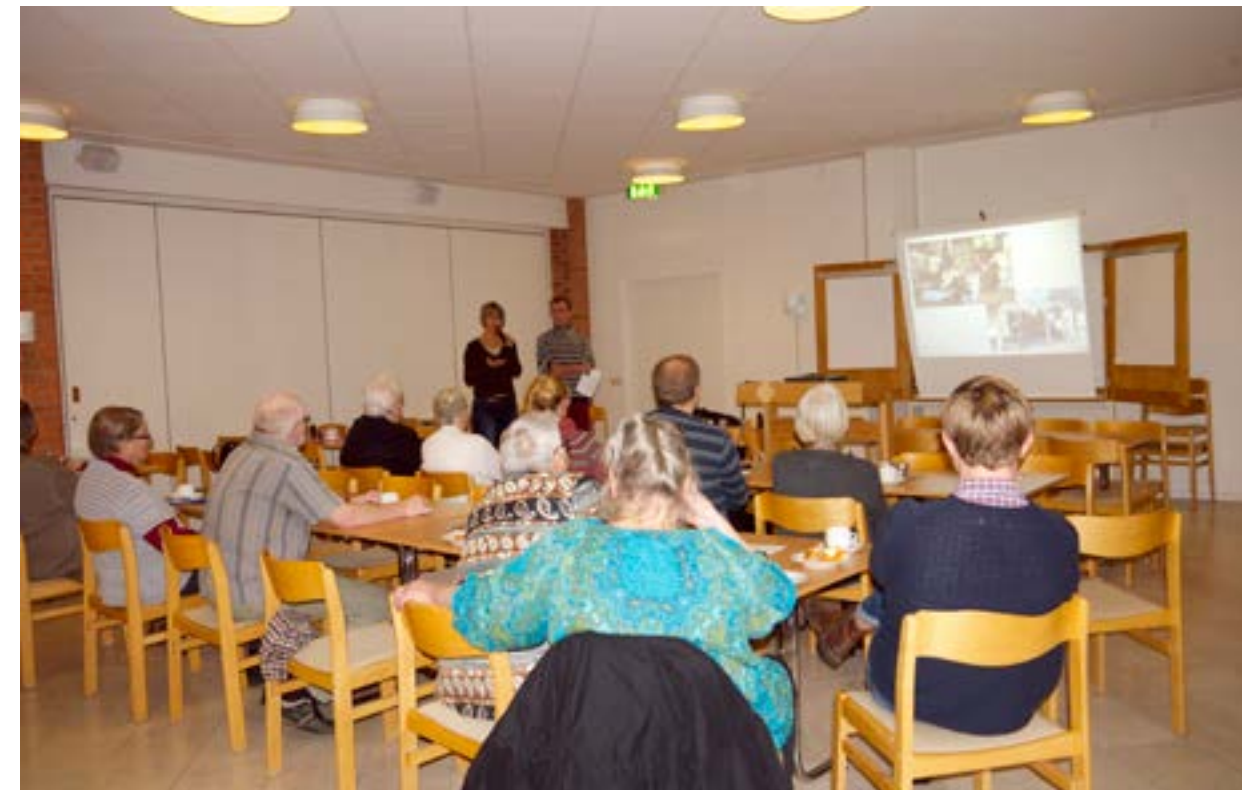
FN-föreningen. Kristianstads FN-förening har samlats i Östermalmskyrkans lokal. En av många lokaler de brukar ha aktiviteter i. Denna dag är femton medlemmar på plats för att lyssna på ett föredrag om funktionshindrades situation på Sri Lanka.

Men en minskning är inte något som Kristianstads FN-förening har påverkat av, i varje fall inte än. Däremot märker de att det är svårt att locka medlemmar till styrelsearbetet. Det är främst de riktiga eldsjälarna som tar