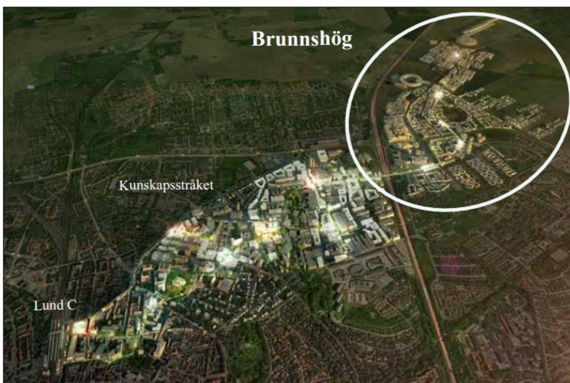
Figur 4.1 Brunnsnög i sitt geografiska sammanhang. Visualisering Arrow 2012.

I nordöstra Lund kommer det inom loppet av 40 år växa fram en helt ny stadsdel, Brunnsnög. Omkring 50 000 människor förväntas arbeta och bosätta sig i området (Lunds kommun 2012:2). Ambitionerna för Brunnsnög är exceptionellt höga, då visionen är att stadsdelen skall bli världens främsta forsknings- innovationsmiljö. De tre komponenter som underbygger denna vision är att Brunnsnög skall innehålla världens främsta forskningsanläggningar, det skall vara ett föredöme för hållbart stadsbyggande och dessutom vara ett regionalt utflyktsmål för kultur, vetenskap och rekreation (Lunds kommun 2012:5).