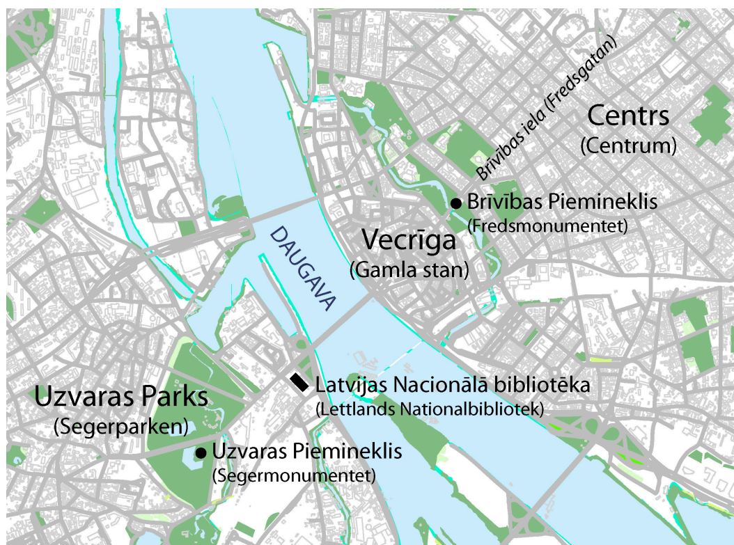
Figur 1. Karta över Riga. Underlagskarta, ej skalenlig (Riga stad 2014b)

Från att tidigare bara ha varit en öppen grönyta antogs år 1908 en plan om att på platsen anlägga en park med grönytor, promenad- och ridvägar, grupper och alléer med träd och parken kom att kallas för Pētera Parks , efter Peter den Store. Under första världskriget avstannade arbetet med parken och en stor del av parken användes som privata trädgårdslotter. 1923 byttes parkens namn till Uzvaras Parks . Namnet symboliserade Lettlands seger och självständighet år 1918 från tsarstyret. Arbetet med parken återupptogs igen först på 1930-talet med planer för en stor plats menad för militärparader och nationella folkfester. 1937 utlystes en tävling för ett stort förändringsprojekt där det planerades för uppförandet av en stor stadion och en plats för arrangerandet av de lettiska sångfestivalerna. 1938 arrangerades den IX Lettiska sång- och dansfestivalen i parken. Alla inkomna tävlingsförslag innehöll en förstärkning av den axel som sträckte sig längs Brīvības iela och frihetsmonumentet till andra sidan floden Daugava och parken. Andra världskriget med både tysk och sovjetisk ockupation av landet satte stopp för dessa planer. Under den sovjetiska ockupationen som varade fram till år 1991