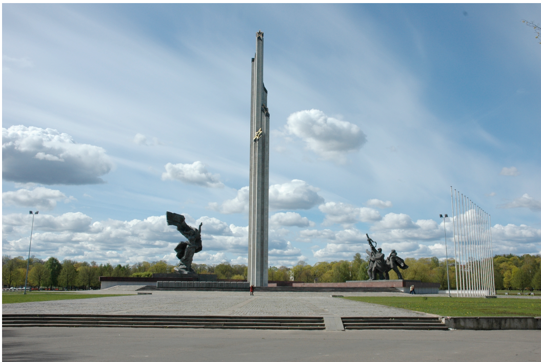
Figur 3. Foto av Uzvaras Pieminēklis . Till vänster syns statyn 'moder fosterland', i mitten obeliskens och till höger statyn 'befrielsens soldater'. Foto: Matilda Kursis, maj 2014.

Min första informant (intervju 1), skulptör och upphovsman till bronsstatyn föreställande en kvinna, förklarade att tanken med utformningen av statyn var att det skulle föreställa en moder med ett barn i sina uppsträckta armar, utformad på ett sådant sätt att barnet alltid skulle befinna sig i solens sken och skulle symbolisera fred för kommande generationer. Barnet togs dock bort av den sovjetiska regimen då det bland annat påpekades att symboliken var religiös och barnet om barnet var mindre än fyra år skulle det innebära att det var ett tyskfött barn (i betydelsen ett det då skulle vara fött under den tyska ockupationstiden). Kvar står därför fortfarande idag denna staty med uppsträckta armar men utan barn. Informanten framhöll även att en av de bärande tankarna med att resa monumentet var att skapa något som skulle vara högre, större och mer imponerande än frihetsmonumentet på andra sidan floden i andra änden av den symboliska axeln. Frihetsmonumentet är 42,7 meter högt (Liveriga 2014b).