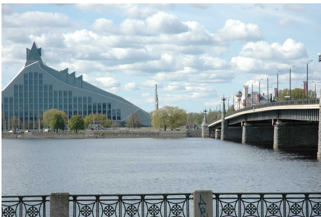
Figur 4. Foto av det nya nationalbiblioteket. Bilden är tagen från Gamla Stan på östra sidan om floden. Till vänster syns det nya biblioteket och i bakgrunden sticker obeliskerna i Uzvaras Piemineklis upp. Bron till höger är Akmens Tilts (sv. Stenbron) och är den del av den 'symboliska axeln' som binder samman stadens östra och västra del av floden. Foto: Matilda Kursis, maj 2014

Det går att dra kopplingar till Fensters (2004) beskrivningar av vilken identitet och tillhörighet som får ta sig uttryck i stadsrummet, hur stadsplanering kan användas som ett aktivt verktyg för att framhäva en specifik kultur eller identitet genom att en annan identitet samtidigt väljs att skymmas.