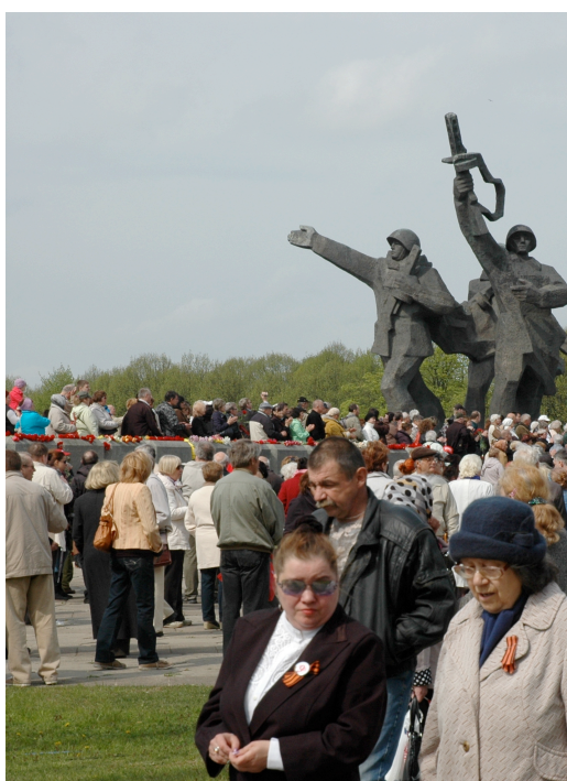
Figur 5. Firandet den 9 maj. Foto: Matilda Kursis, maj 2014.

Precis som i Lights beskrivningar av hur den förändrade användningen av Causescus palats överskuggar byggnadens koppling till den totalitära regimen tycks den förändrade användningen av Uzvaras Parks också fått effekten eller haft just samma avsikt. Ett försök att koppla bort parkens starka associationer med sovjetregimen.