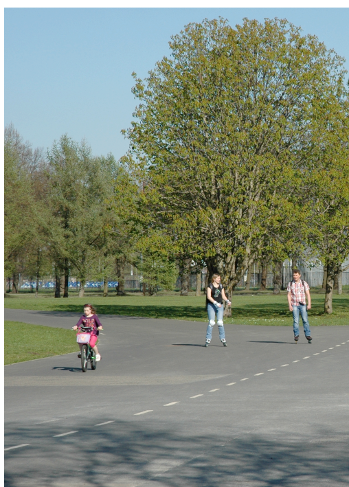
Figur 6. Sportaktiviteter i parken. Foto: Matilda Kursis, maj 2014.