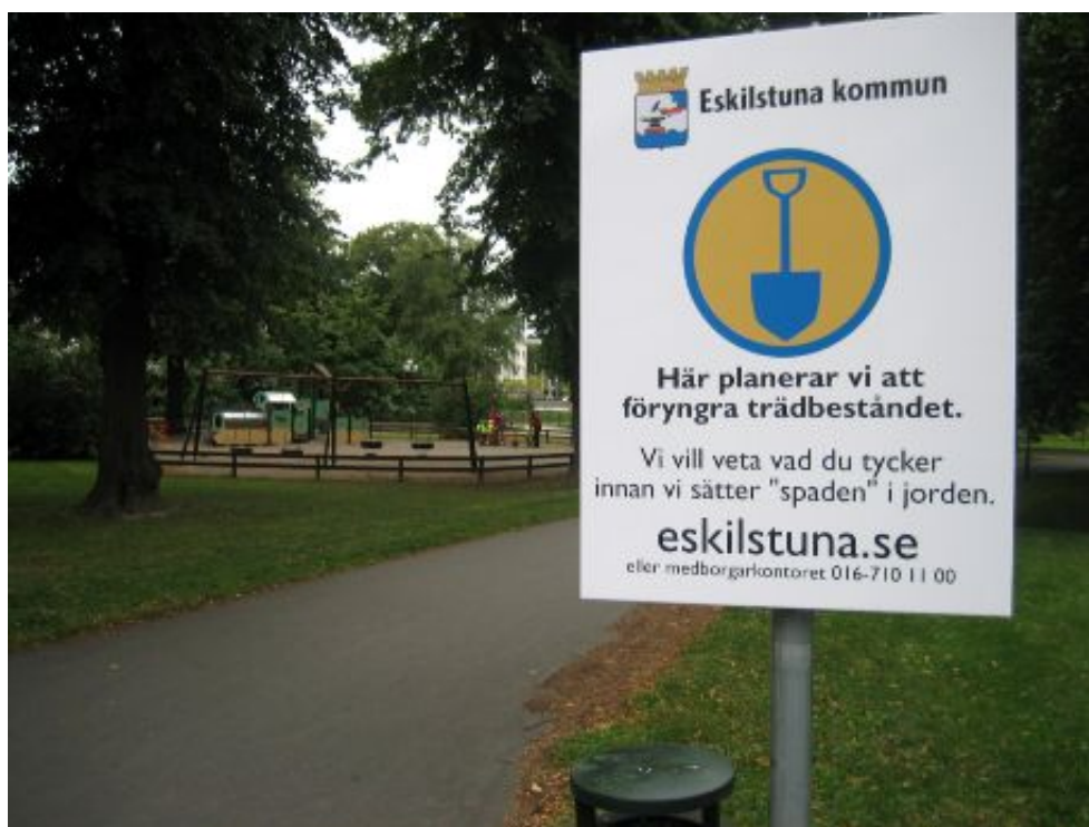
Figur 5.2. Informationsskylt inom Spadenprojektet.

Ett exempel på en informationsåtgärd är Spadenprojektet. Det går ut på att kommunen sätter upp en skylt med en spade och information om att de vill få in synpunkter från invånarna innan ett visst projekt börjar, se figur 5.2. Syftet med projektet är att få in synpunkter så tidigt som möjligt (Intervju 3.).