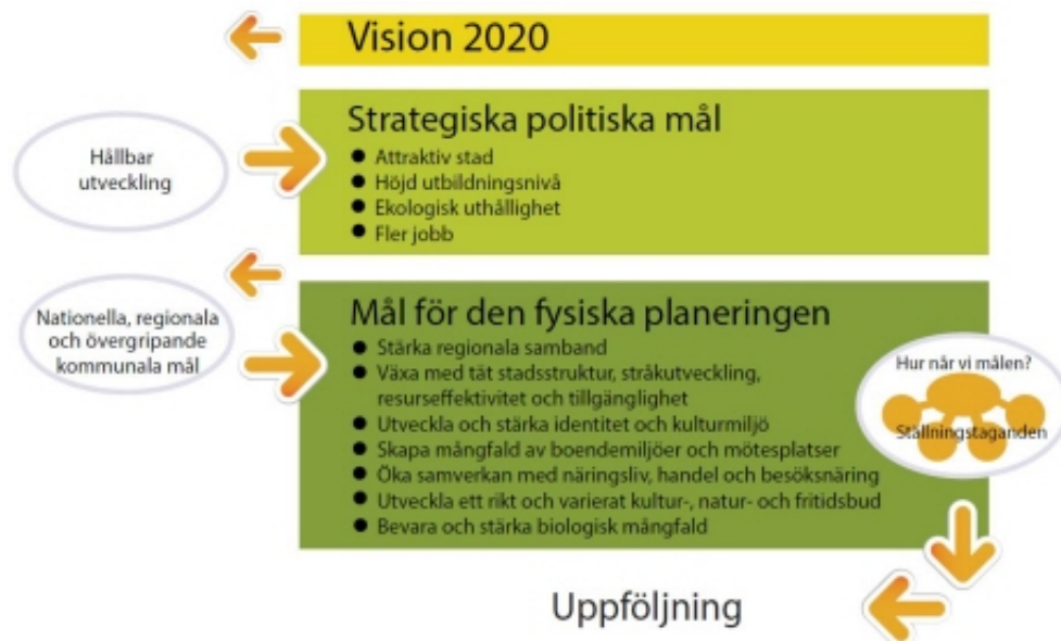
Figur 5.1. Eskilstuna kommuns strategiska politiska mål samt mål för den fysiska planeringen.

Hållbar utveckling ska uppnås genom förtätning och funktionsintegrering 6 då strukturerna blir mer kostnadseffektiva (Eskilstuna kommun 2014g). Långa avstånd mellan olika funktioner i staden ger både kommun och invånare högre kostnader genom t.ex. högre anslutningsavgifter ( ibid. :2014h). På så sätt ger förtätning kommunen mer pengar till att utveckla stadsmiljön. Funktionsintegrering bidrar också till trygghet och säkerhet då människor rör sig i staden vid alla tider på dygnet ( ibid. ).