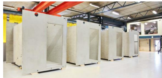
Figur 3 VeidekkeMAX installationsmodul

Kärnan i VeidekkeMAX byggsystem är den så kallade installationsmodulen som utgörs av en badrumsmodul med installationer för kök och el. VeidekkeMAX har inte som mål att vara ett koncept separerat från Veidekkes traditionella verksamhet utan ska mer ses som en utveckling av hela byggverksamheten. VeidekkeMAX kan sägas ha en bra integration mellan produkt- och produktionsstrategi då de har ett byggsystem med hög flexibilitet och ett erbjudande som är riktat mot en bred kundgrupp.