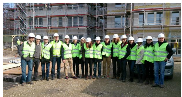
Figur 1 Besök hos Moelven Byggmodul

Kartläggningen av de fyra företagen gjordes genom en fallstudie. De koncept som studerades var VeidekkeMAX, Skanska BoKlok, Peab PGS och Moelven Byggmodul. De olika företagen besöktes under en studieresa i södra Sverige. Möjlighet gavs också att besöka Peab PGS och Moelvans fabriker.