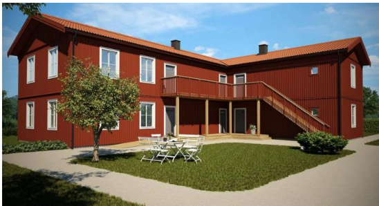
Figur 2 Skanska Boklok Classic

Prefabriceringsgraden är hög och försöker maximeras då den ger effektiv produktion, stabil kvalitet och god kontroll över byggprocessen. Alla fallföretagen producerar flerbostadshus men de har olika tankar kring hur produkt- och produktionsstrategier ska användas.