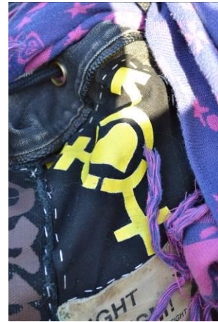
Bild 7, 8, 9: Transsymbolen och transkampssymbolen som smycke, målad som del av tygpadge på baksidan av jacka och som tygpadge på ryggsäck.