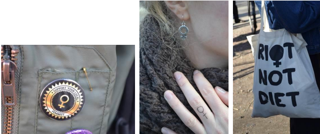
Bild 1, 2, 3: Kvinnosymbolen som knapp, örhänge, sminkad och som del av tygpåse.

Här följer exempel på fotografier på symboler som ingår i mitt material. Fotografierna förekommer också i analysdelen.