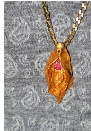
Bild 10, 11, 12: Fittor samt My Little Pony burna som tygpåse, tygpadge på ryggsäck och som smycke.