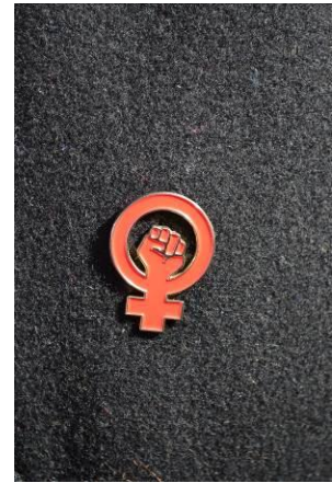
Bild 16, 17, 18: Kvinnosymbolen buren i form av en tårta, regnbågsfärgad kvinnokampssymbol buren som knapp och kvinnokampssymbolen buren som nål.