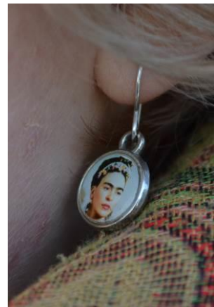
Bild 13, 14, 15: Variant på kvinno- och transsymbolen samt kvinnosymboler, burna som del av banderoll, Pussy Riot som del av banderoll och Frida Kahlo burnen i form av ett smycke.