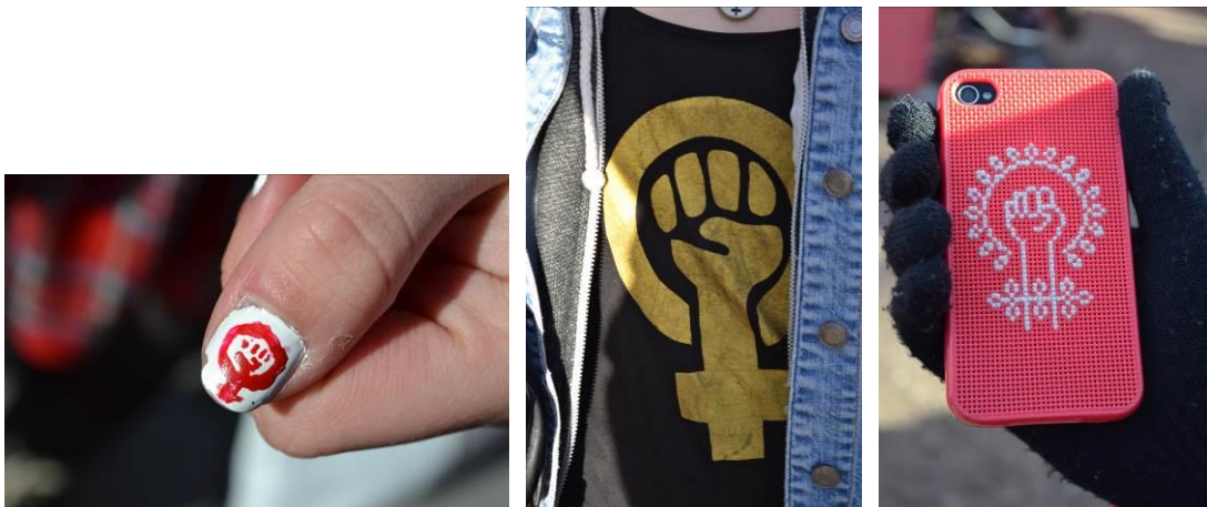
Bild 4, 5, 6: Kvinnokampssymbolen som sminkad, T-shirt och broderad på mobilskal.