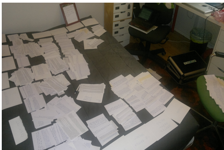
Så här såg sorteringen ut i verkligheten, med forskningsfrågan inramad i mitten längst upp.