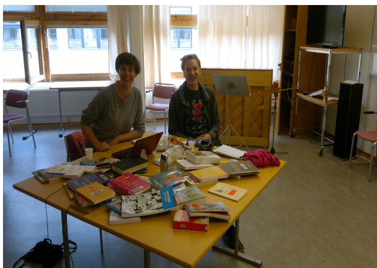
Vår arbetssituation: öppet möblerat klassrum, många böcker, glada miner, till höger skymtar whiteboarden. (2:4, 2012-10-03)