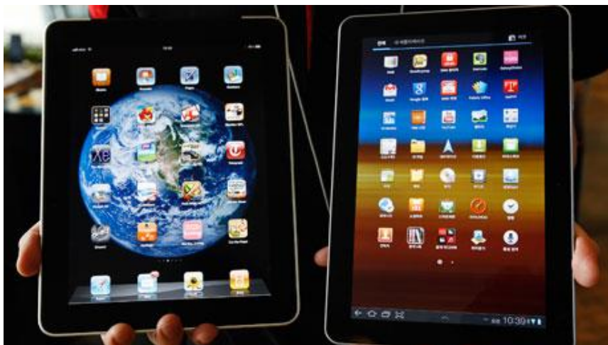
Figur 1: En iPad 3 och en Samsung Galaxy Tab.

Android är ett öppet mobilt operativsystem för smartphones och surfplattor. Namnet kommer ifrån Andy Rubin som grundade företaget Android Inc. 2003. Google köpte upp företaget år 2005 ( Bloomberg Businessweek, 2005 ). Det var då utvecklingen tog rejäl fart och Android gjordes till ett mobilt operativsystem ( Social solutions, 2011 ). Skillnaderna mellan en iPad och en Android-platta är inte så utseendemässig utan snarare av teknisk karaktär. De är väldigt lika varandra, t.ex. på så sätt att man laddar ner appar från en online-butik, App Store eller Google Play.