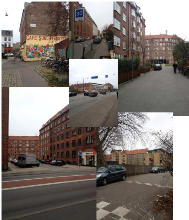
Figure 5.2: Mer av Sundholm.

mig om att det har funnits goda möjligheter att delta för alla som kan tänkas ha något intresse, men de Liefde m.fl. (2012) hävdar att enligt deras undersökning, stämmer inte detta då olika människor har olika möjlighet att delta, eftersom alla inte söker sig till den mer formella typen av forum. De analyserade kompositionen av styrgruppen och kom fram till att det inte är en representation av de olika grupper som lever och verkar i Sundholm, och därför är inte styrgruppen en reflektion av dem. Det verkar som att grupper av lägre socio-ekonomisk status är (om än inte uttalat) exkluderade från processen (ibid:60). Socialpedagogen jag intervjuade menar att de hemlösa har påverkat projektet, genom honom, då han framfört deras perspektiv och önskemål under olika möten, etc. Han hävdar också att de flesta ställer sig positiva till de förändringar man genomfört runt om i Sundholm, när man väl förklarat för dem varför man har gjort dem. Vidare menar de Liefde m.fl. (2012) att de boendes medverkan har genererat endast oansenliga resultat som en följd av brist på makt, vilket tyder på att den hierarkiska strukturen är mer vertikal än vad man ger sken av (ibid:59). Anledningen till att boende inte känt sig motiverade att delta beror inte endast på att de inte känner att de har haft tid, utan också att de ifrågasätter vikten av deras medverkan (ibid:63), alltså: gör medverkan verkligen någon skillnad?