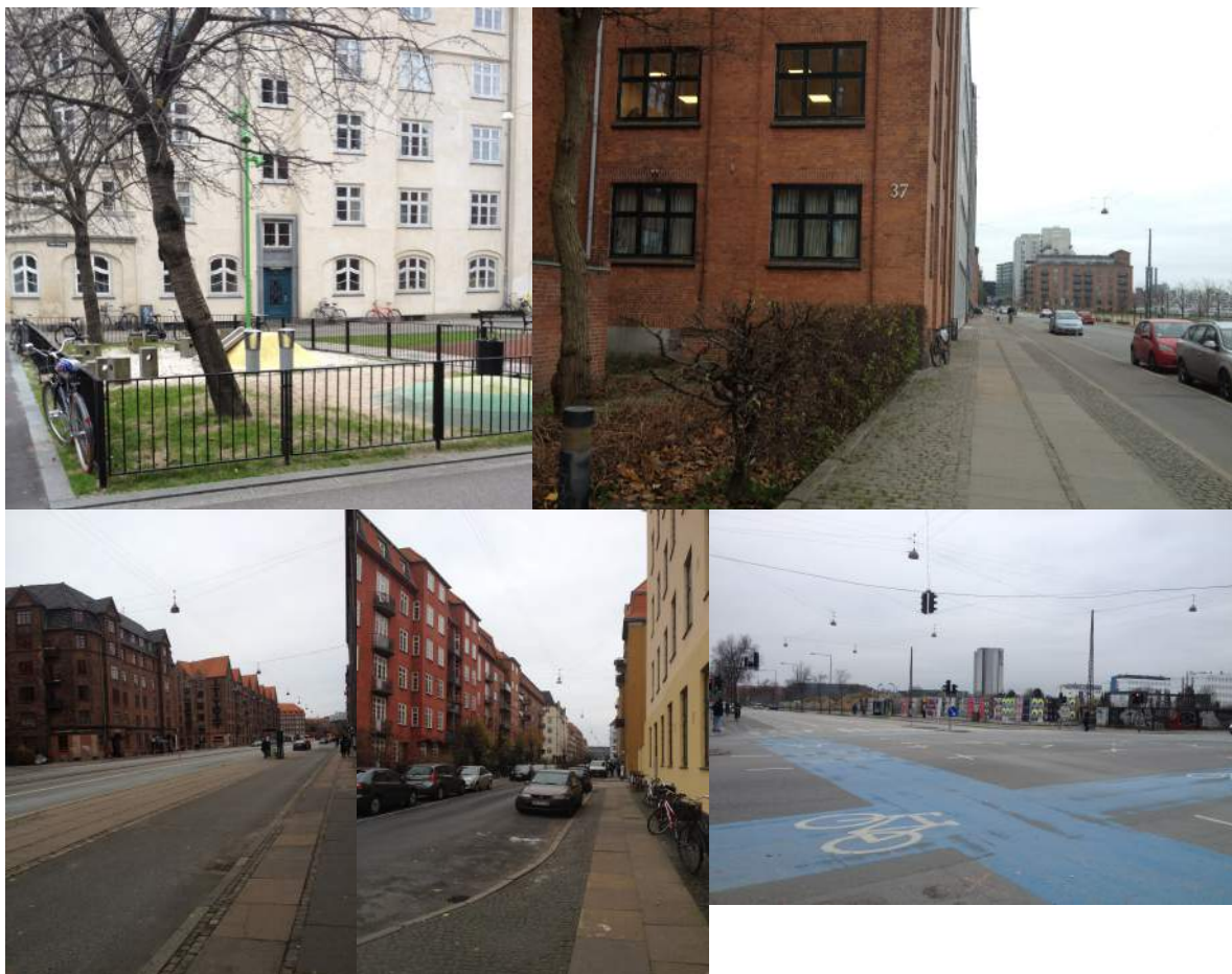
Figur 4.1: Sundholm.

Överlag var Sundholmsborna en ganska varierad grupp. Under en av laddningspauserna hade jag god uppsikt över de som rörde sig längs Amagerbrogade. Unga och gamla, många cyklister, en hel del barnvagnar. Det var äldre par som hade varit i sin lokala butik och handlat för dagen, föräldrar som följde sina barn hem från skolan, någon som var ute och gick med hunden. Denna gata var relativt välbefolkad, jämfört med de inre delarna av Sundholm. Jag utförde mina observationer runt lunch-tid och lite senare på eftermiddagen, en tid då de flesta är på arbetet – vilket kan förklara varför jag upplevde att det inte var särskilt mycket människor i vissa delar av området. Vädret i december i Köpenhamn är inte heller optimalt.