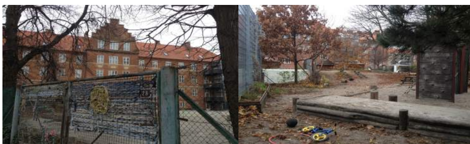
Figur 5.3: Amager Fælde Skole.

Resonemanget som fördes i föregående avsnitt om hur övriga invånare kan ställa sig skeptiska till närvaron av hemlösa, missbrukare och annat som deras närvaro för med sig är applicerbart även här. I byhaven börjar man morgonen med att städa undan kanyler med mera, men det finns inget nämnt om något sådant nämnt i hänvisning till den nya skolgården. På skolgården skulle konsekvenserna av att barn hittade något sådant vara värre än när de besöker byhaven, eftersom lärare inte håller samma uppsikt där. Även om detta inte blir utfallet kan föräldrars och övriga invånares oro för möjligheten vara tillräcklig för att motverka arbetet att främja den sociala aspekten i Sundholm. Som tidigare nämnt verkar det heller inte finnas sociala nätverk, som i byhaven, som kan verka för den sociala aspekten i det här initiativet.