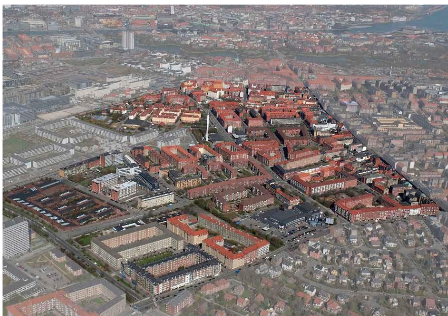
Figur 5.1: Luftfoto av Sundholmsvejkvarteret. Fotograferat i nordlig riktning. I bakgrunden ses Christianshavn och City.

De sex år som projektet pågick var uppdelat i tre faser: idé-fasen, ”implementering och drift” och förankring. Inför varje fas tillsattes en ny styrgrupp och respektive styrgrupp fick sedan sitta i två år. Styrgruppen skulle bland annat fungera som en slags mellanhand mellan politiker och planerare och resten av medborgarna. Vidare förklarade projektchefen att styrgruppens medlemmar fick en slags funktion som ambassadörer för områdeløft-projektet. Detta var mycket positivt, menade han, eftersom övriga boende fick tillgång till information på ett tillgängligt och förtroendeingivande sätt, då folk alltid har större tilltro till sina jämlingar. Då jag frågade hur de valt ut medlemmarna i styrgruppen, svarade han att det inte hade varit något problem, utan att de som ansökt har fått vara med (se 4.2., de Liefde m.fl. 2012:11). Övriga försök att nå ut till allmänheten genom kommunikationsverktyg som Facebook, events, kontakt med de lokala tidningarna med mera (ibid:11). Men de Liefde m.fl. (2012) fann i sin undersökning om medborgardeltagande i Sundholm att detta inte verkar stämma överens med allmänhetens uppfattning. Både att majoriteten av de boende i Sundholm inte var tillräckligt väl informerade om projektet i fråga, samt att de som ingick i styrgruppen valdes med hänsyn till kvaliteten och kvantiteten på deras kopplingar till områdeløftet (s.66).