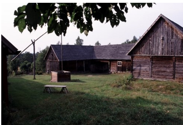
Figur 3: Sporrakulla gård i Östra Göinge kommun.

Ett av de besöksmål som föreslås i turistbroschyren är Sporrekulla gård (Östra Göinge kommun, 2012:9). Gården omnämns i texter från 1650-talet där det bland annat står att