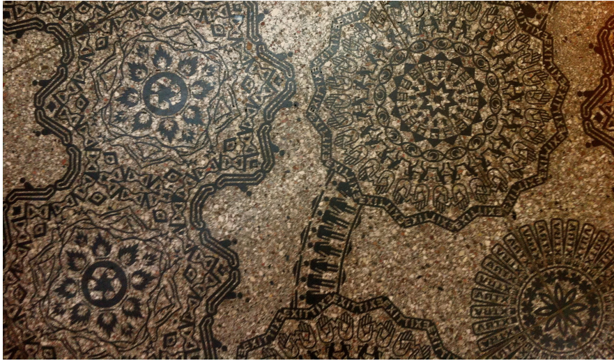
Moderna symboler i orientalisk stil

en stund på perrongen. Att hålla borta element som stör ordningen är således lika viktigt på denna plats trots dess intuitiva känsla av ett motsatsrum till det konsumistiska rummet.