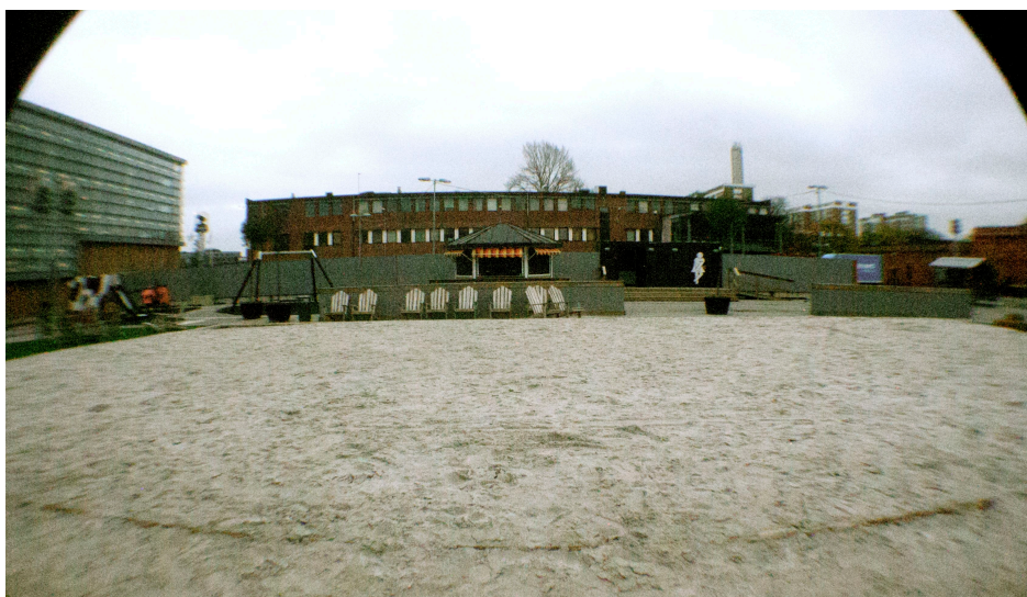
Sandstrand i stadsmiljö