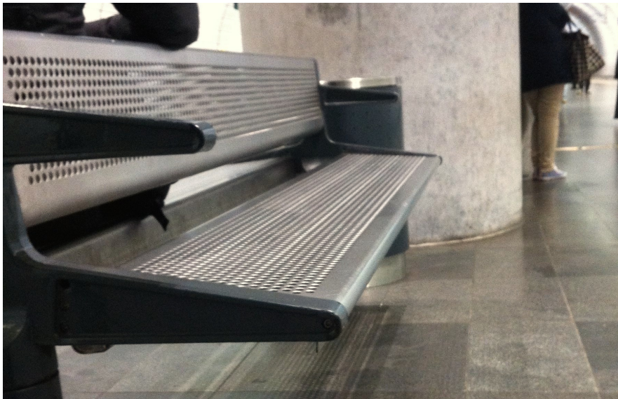
Sluttande bänk på perrong

Detta rum skapar således vårt avståndstagande förhållningssätt till konsumtionssamhällets kultur, men skyddar oss samtidigt mot de farhågor som kan störa skapandet av självet. Den som åker ner till perrongen passerar allt som oftast förbi några väktare som påminner om ordningen. Bänkarna på torget och perrongen förhindrar spontant användande av platsen och försvårar fysiskt för människor som inte anses höra hemma på platsen att vara där. Genom den nya Citytunneln binds också stadens enklaver ihop och skapar ett kortare avstånd för människorna i stadsarkipelagen.