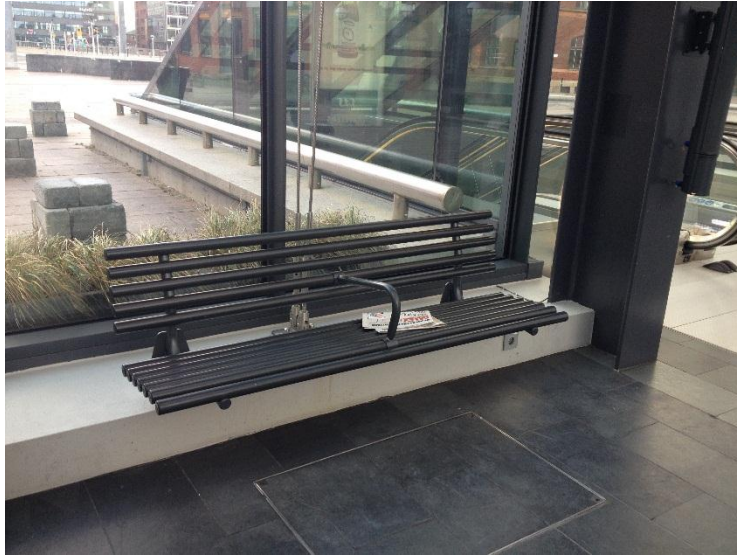
3.4.3.1: Bänk med armstöd i vänthallen på Centralstationen.