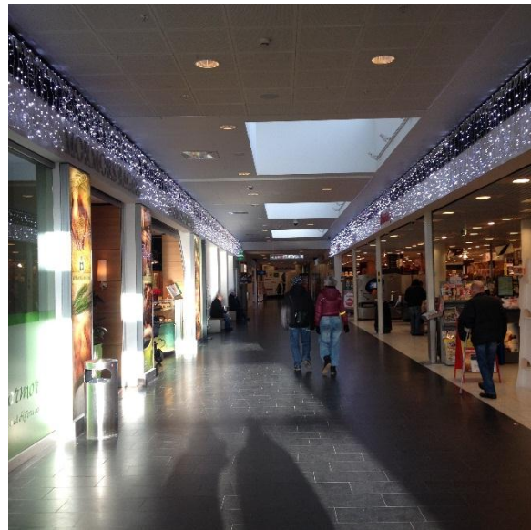
3.4.1.1: Bild på Entré. Längre in på bilden syns de bänkar som de hemlösa ofta sitter på.

Under min observation av köpcentret Entré vilket är beläget precis vid Värnhemstorget lägger jag märke till att det ligger relativt nära Stadsmissionen. Utanför Entré finns även knutpunkten för kollektivtrafiken som går från Värnhem. Entré håller för närvarande på att byggas om och därför finns det endast ett fåtal butiker öppna men dessa är bland annat Hemköp, H & M och Systembolaget. Bilden nedan visar ingången till Entré samt området precis utanför Hemköp där det finns bänkar och toaletter. Dessa anrättningar används ofta av personer som skulle kunna tillhöra gruppen hemlösa eller missbrukare då Värnhemstorget och Entré, liksom det nämns i intervjuerna, är vanliga mötesplatser för dessa personer.