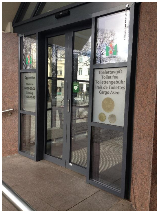
3.4.4.1 Offentlig toalett på Gustav Adolfs torg, Malmö