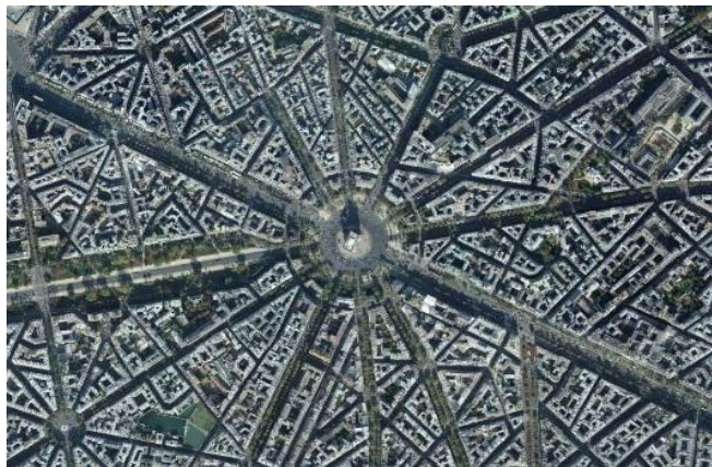
2.2.1 Fig 3: Bild från ovan över Paris gatunät. (Google 2, 2015)

Harvey menar att staden förändras i takt med hur världen förändras och vilka olika kapitalistiska kriser eller problem som uppstår längs vägen. Som exempel på detta tar han upp Haussmann's renovering av Paris som skedde på grund av att man ville öka övervakningen i staden samt verka för förbättring och förnyelse. Denna renovering av Paris inkluderade demolering av centrala arbetarbostäder och kvarter, anläggning av gigantiska boulevarder, parker och torg samt att man byggde förorter för arbetarna utanför Paris. (Harvey, 2008:28) Det som denna förbättring och förnyelse egentligen stod för var förflyttningen av arbetarklassen från centrum till de perifera delarna av Paris. Detta eftersom arbetarklassen ansågs utgöra ett hot mot lag och ordning inne i stadskärnan. Denna förändring av Paris fysiska utformning skapade en stad där det var möjligt att övervaka samt motverka uppror på ett effektivt sätt. (Harvey, 2008:33) Denna typ av fysisk planering bidrar även till radikala förändringar i livsstil samt förflyttning av människor och fick på sikt stora sociala konsekvenser som uppror i Paris förorter än idag. Dessa förorter utgör idag centrum för missnöje och befolkas av ungdomar, arbetslösa samt invandrare. (Harvey, 2008:28)