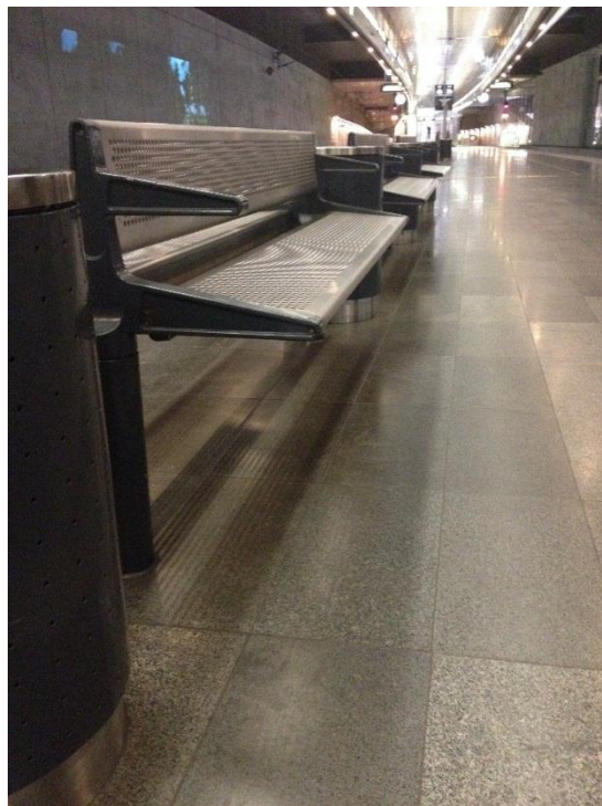
3.4.3.2: Sluttande bänk på perrongen på centralstationen