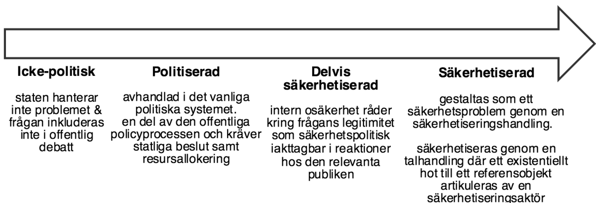
Figur 1: Policyprocess

Genom diskurspsykologisk analys av utvalda debatter i Riksdagens kammare mellan år 2007-2013 samt relaterade policydokument används beskrivna analytiska ramverk redogjorda i avsnitt 2.2 i kartläggandet av de politiska frågornas processer i den rörelse vilken presenteras i Figur 1. Genom en säkerhetsiseringsprocess avses i denna studie en frågas rörelse från vänster till höger i spektrumet genom en talhandling och hotbildsgestaltning. Enligt teorin kan politiska processer med samma logik fungera åt motsatt riktning. Aktiva handlingar av avsäkerhetisering genom att tala om någonting som ett icke-hot kan få en fråga att avstanna eller röras åt vänster i Figur 1 (Eriksson 2004, 71-72).