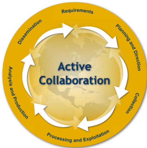
Figur 2. Den svenska försvarsmaktens beskrivning av underrättelsecykeln. 7