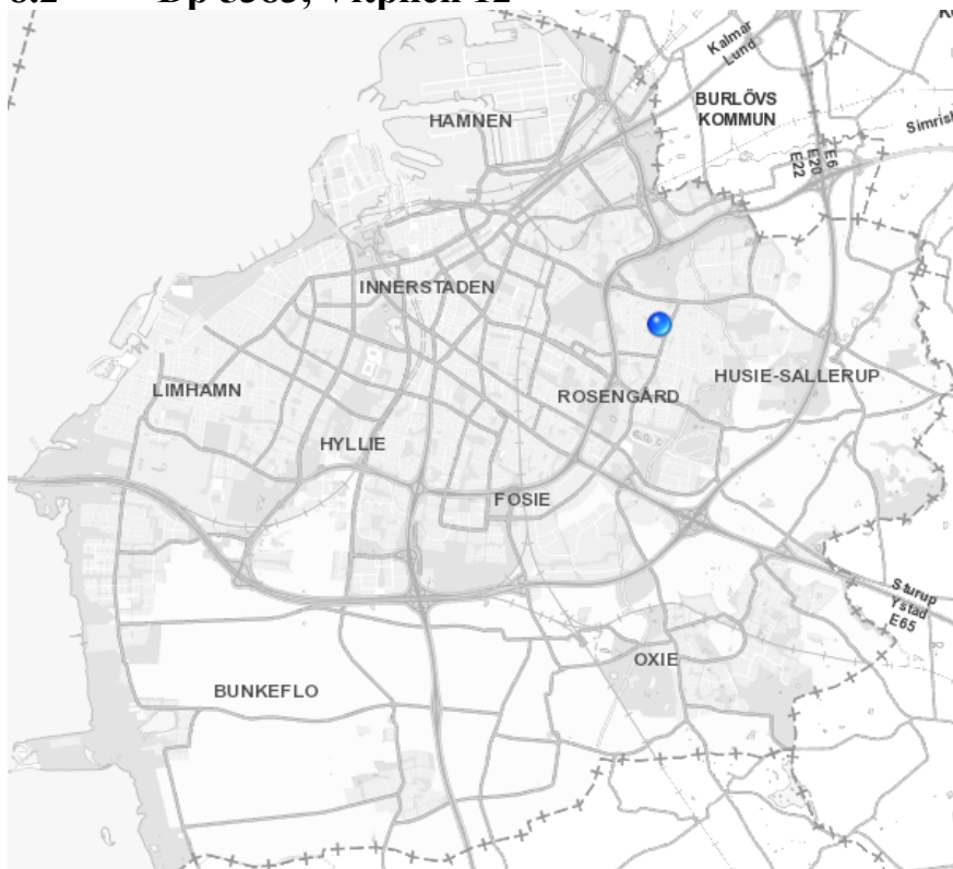
Figur 2: Referenskartan Vitpilen 12, Husie, Malmö (Malmö stad 2015d).

Detaljplanen avser fastigheten Vitpilen 12. Syftet med upprättandet av detaljplanen är att de tillfälliga paviljonger som idag rymmer 40 elever och fyra lärare ska kunna göras permanenta. En gång- och cykelväg ska upprättas längs med den södra plangränsen. I den norra delen av området är marken avsedd för skolgård. Här finns i dagsläget en del vegetation, några uthus samt lekyta och bollplan. Detaljplanen fastställer emellertid att lekvärderna genom relevant gestaltning bör förstärkas samt att mer inslag av växtlighet är önskvärt. Området för detaljplanen ligger i direkt anslutning till en större skolgård i öster där det även finns fler skolbyggnader (Malmö stad 2015b, ss 1, 3-4).