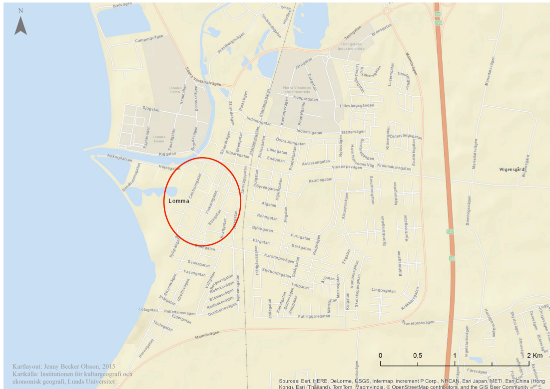
Figur 5.3, Kartan illustrerar centrumområdets placering i Lomma stad

Kartmaterial: Institutionen för kulturgeografi och ekonomisk geografi, Lunds Universitet