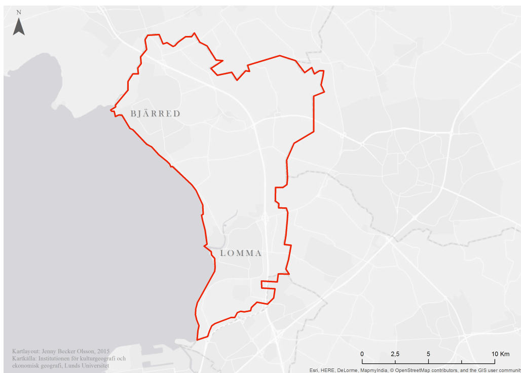
Figur 5.2. Kartan illustrerar Lomma stads placering i Lomma kommun