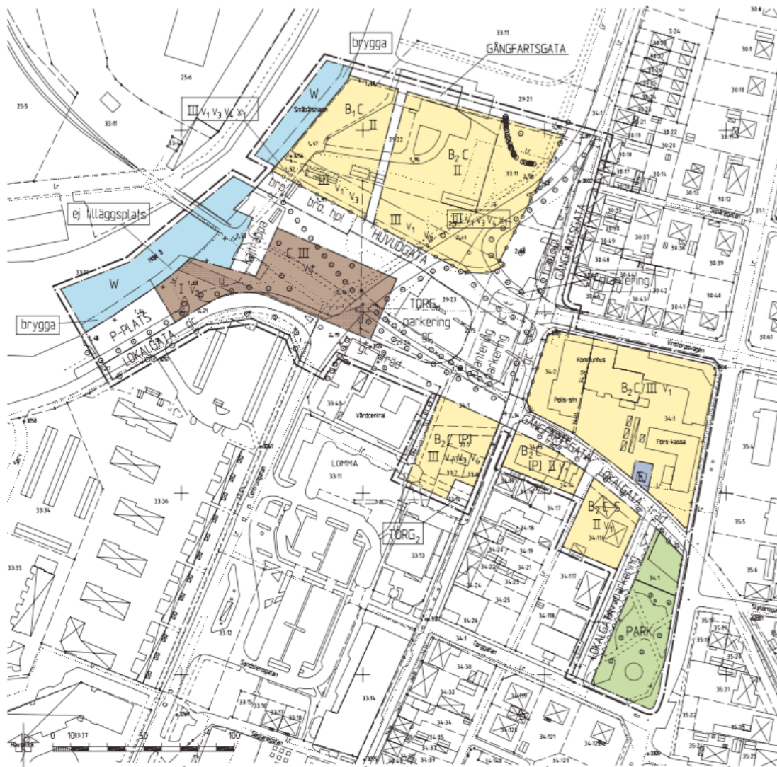
Figur 5.6, Plankarta över Hamntorget, Källa: Lomma kommun, 2007[b]:1