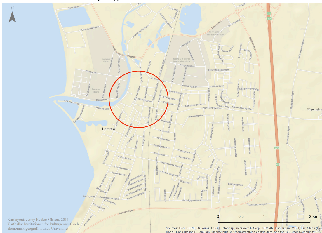
Figur 5.4, Kartan illustrerar hamnområdets placering i Lomma stad