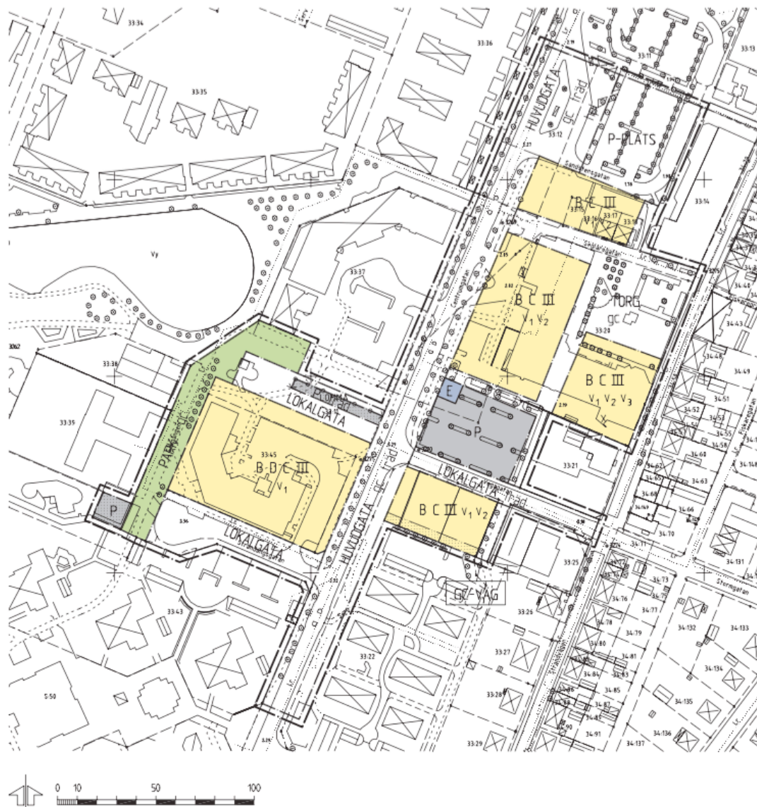
Figur 5.5 Plankarta över Centrumtorget

Stadens mest centrala delar är det som omfattas av detaljplanen för Lomma centrumtorget. Området är omkring 4,5 hektar och illustreras figur 5.3 (Lomma kommun, 2007[a]:3).