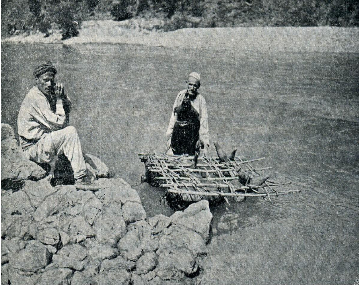
EL1909.007: "Goatskin raft crossing the Drin River at Toplana" (Photo: Erich Liebert, 1909). This photo was also published by Ernst Jäckh, 1911.

En flåte laget av geiteskinn ble brukt som transportmiddel ved elven Drin