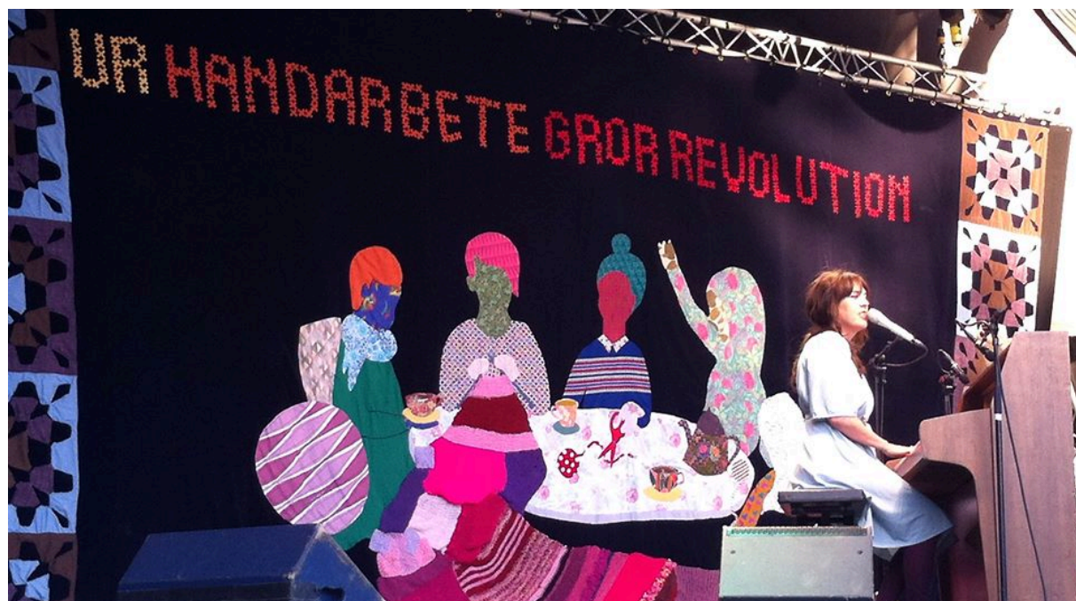
Förenande Progressivt hantverk, 2014

backdopen om att handarbetandet är politiskt. Backdopen används också som ett sätt att få ut vissa värderingar. De mer explicita värderingarna som tydligt går att läsa på backdopen är kopplade till revolution som står för en önskan om något annat bortanför det nuvarande systemet. Backdopen användes sedan på utomhusscenen i en av Malmös största parker och blev på så vis synlig med både det direkta budskapet på backdopen men också med mer indirekta budskap kopplat till handlingen och material.