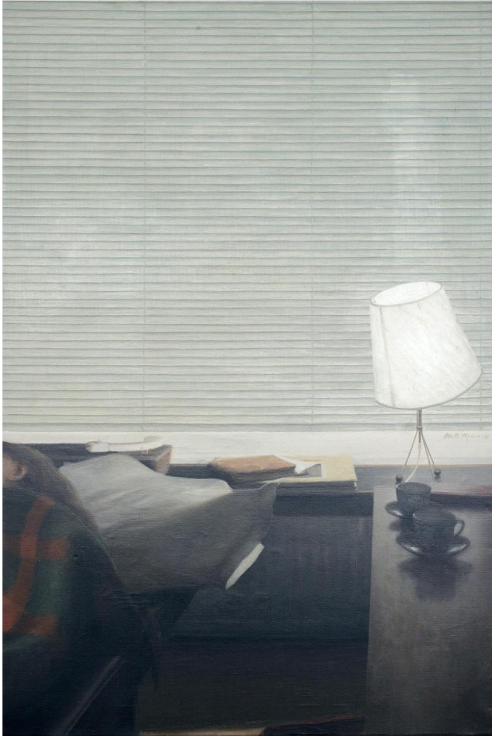
Fig. 1. Ola Billgren, Persienn , 1965, olja på duk, 91 x 82 cm. 44