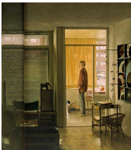
Fig. 5. "Rummet på andra sidan" passar nästan ihop med vardagsrummet på vänster sida i målningen.

Målningen kan sägas bestå av fem rum eller om man så vill fem spatiala skikt. I förgrunden ligger vardagsrummet och "rummet på andra sidan". Längre in i bildrummet finns köket, som tredje rum. I utsikten genom fönstren ser man den asfalterade gården utomhus som ett fjärde skikt. Och till sist det femte skiktet som utgörs av lägenheterna i flervåningshusen på andra sidan gården.