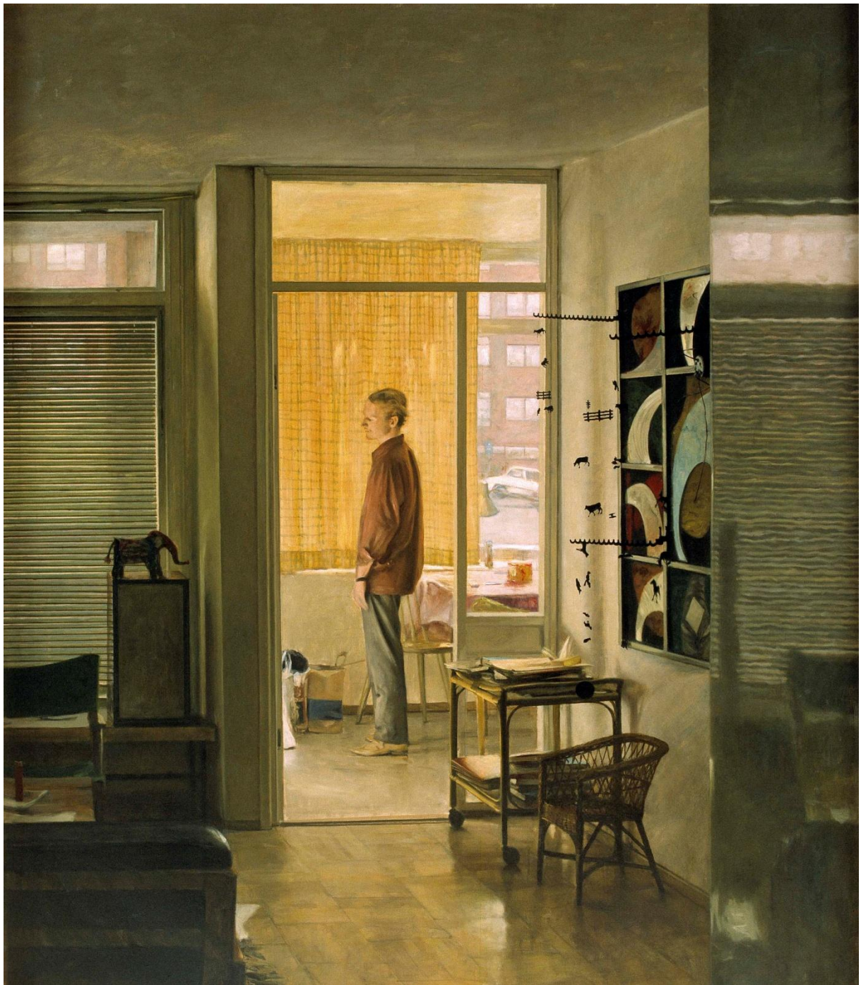
Fig. 4. Ola Billgren, Interiör , 1971-72, olja på duk, 115 x 130,5 cm. 56