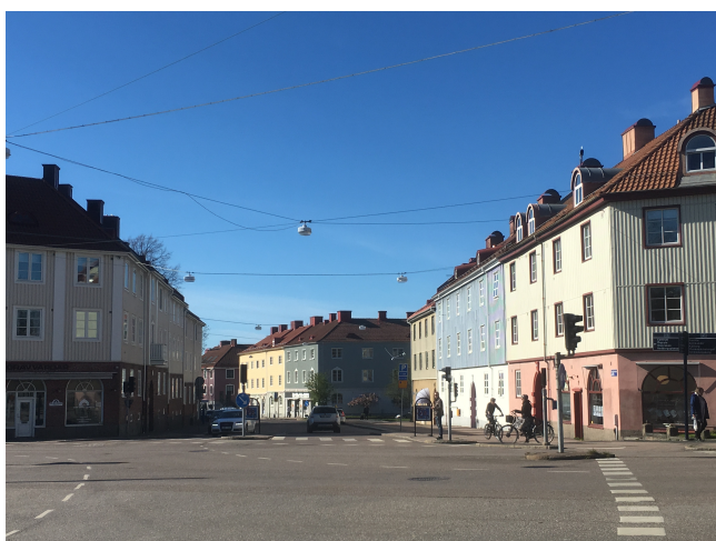
Figur 2. Stockholmsgatan. 26-04-2016