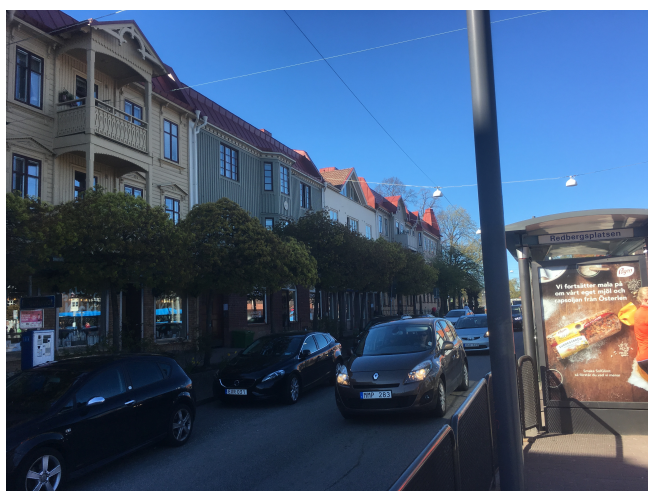
Figur 3. Redbergsplatsen.