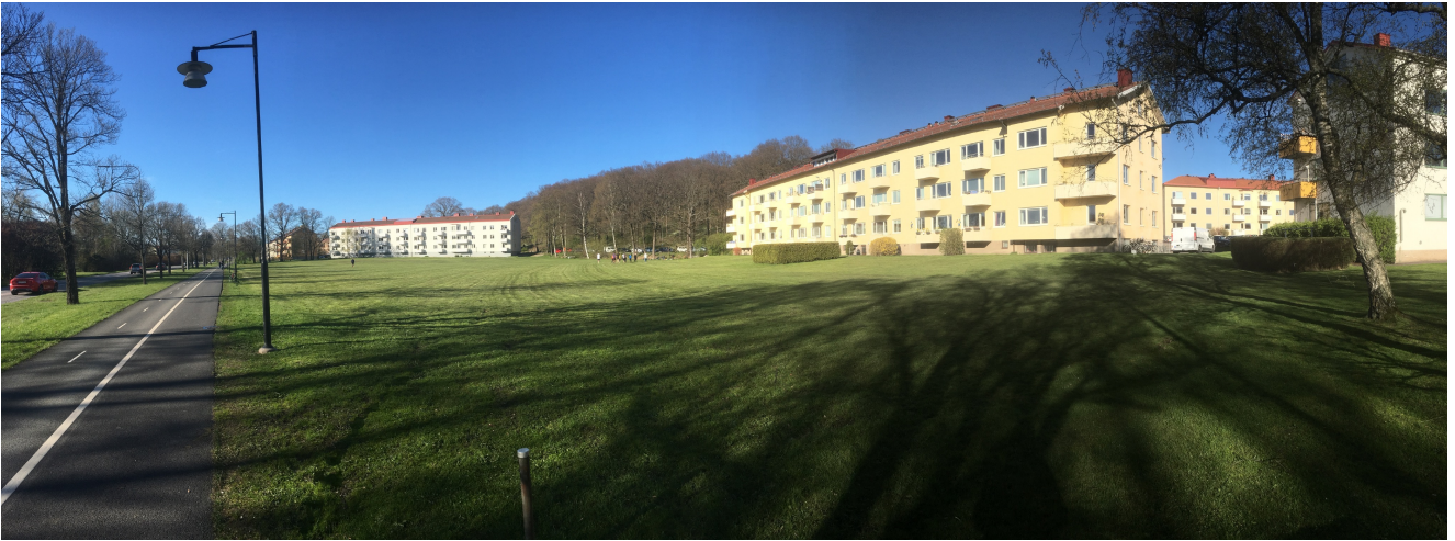
Figur 6. Kärralundsvallen. 26-04-2016