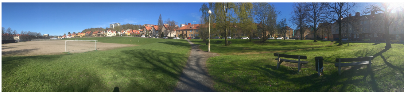
Figur 1. Panoramabild över Ånäsfältet. 26-04-2016