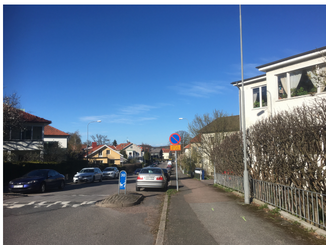
Figur 5. Kärralundsgatan. Området mellan plats A och B. 26-04-2016.