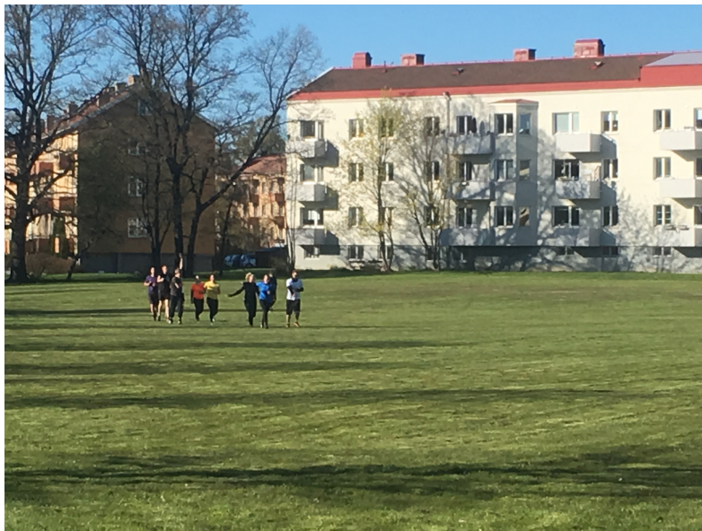
Figur 7. Aktivitet på Kärralundsvallen. 26-04-2016