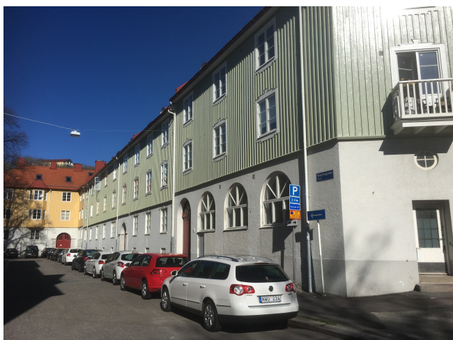
Figur 4. Gata i närhet till Ånäsfältet. 26-04-2016