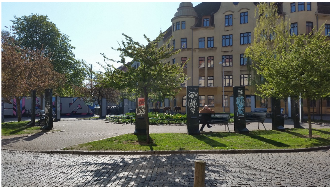
Figur 2. Rondellen klockan 09:30 tisdag den 3 maj.

I delområdet Möllevången, i anslutning till anrika Folkets Park finns en rondell som knyter an Kristianstadsgatan med Norra och Södra Parkgatan. Denna rondell har fått stor medial uppmärksamhet de senaste åren på grund av att personer står och säljer narkotika öppet på gatan. I folkmun talas det om "Knarkrondellen" enligt både Informant 1 och 3. Vidare beskriver Informant 1 platsen som extrem, jämfört med andra platser där det säljs narkotika, med anledning av sättet som försäljningen sker på. Att det står någon där och säljer mitt på dagen verkar inte vara något konstigt. Det är inga stora mängder narkotika som säljs per transaktion, men det förekommer många transaktioner. Polisen har tidigare valt att inte lägga sina resurser på de som säljer i så små mängder, utan de har istället riktat in sig på de större partierna narkotika. Den pågående narkotikaförsäljningen har inte bara fått uppmärksamhet från grannar och media, utan även från andra typer av brottslingar som ser att det finns pengar att tjäna där – genom att råna andra (Informant 1). Det har skapat diskussioner kring säkerheten och den upplevda tryggheten på platsen då det finns både bostäder samt en förskola där som har varit utsatta för både försäljning och påverkade personer vid ingången till verksamheten (Informant 2).