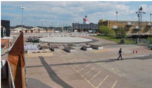
Figur 2. Odlingsbäddar med rollerderbybanan i bakgrunden.

Den utveckling och planering som sker motiveras i linje med de övergripande Vision Älvstaden samt 1680 idéer om Göteborgs 400-årsjubileum som bakgrund. Två dokument som sammanfattar sedan innan insamlade tankar om stadens utveckling där närhet till havet och deltagande är vanligt förekommande (Göteborg & Co, 2012:283; Göteborgs stad, 2012:10; Göteborgs stad, 2016a:9, 12, 16). På platsen finns idag en allmän bastu, en seglarskola, en rollerderbybana, urbana odlingsmöjligheter, en lekplats med vattenkonst samt ett bad (Göteborgs stad, 2016a:2, 5, 7), visuellt presenterade i bilderna nedan.