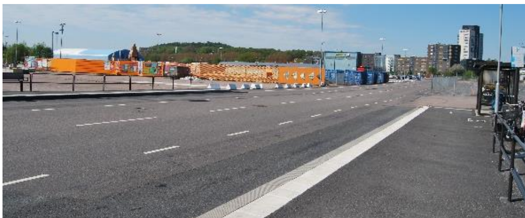
Figur 10. Busshållplatsen Frihamnsporten.