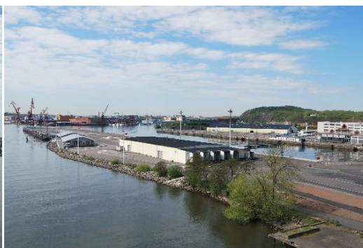
Figur 8. Frihamnen i Göteborg - Norr om älven, vy från Götaälvbron.

Från bron anas parkens lokalisering då karaktäristiska orangea markeringar för Älvstaden, en färg jag känner igen från olika hemsidor och dokument, syns en längre bit in i Frihamnen, synligt i Figur 9 . Uppe i vänstra hörnet syns den orangea markeringen. Från bron, visat i samma figur höger i bild, syns även en stor informationstavla med texten: "Hej! Här ska vi bygga ut Frihamnen i vårt nya, nära Göteborg". Inte från något håll finns Jubileumsparken med på några gatuskyltar för cyklister och gångtrafikanter, istället finns hänvisningar till Frihamnen. Ordet "Playan" sprayat på asfalten är det enda tecken jag hittar som hänvisning mot parken.