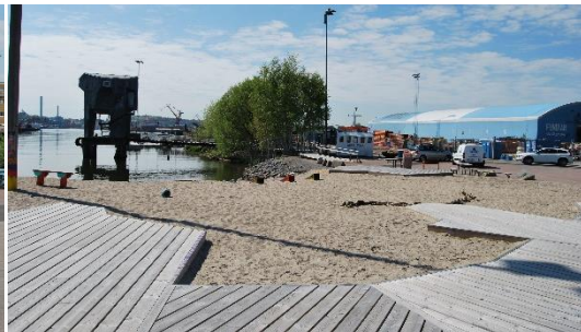
Figur 3. Bastun och playan.