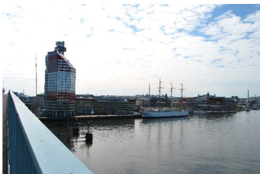
Figur 7. Göteborg - Söder om älven, vy från Götaälvbron.