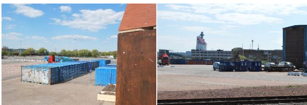
Figur 11. Jubileumsparkens omgivning. Källa: Joó, J. 2016. Figur 12. Jubileumsparkens omgivning, åtkomst från norr. Källa: Joó, J. 2016.

På frågan om vad informanterna ansåg att den geografiska placeringen av parken har för betydelse för resten av staden påpekade Informant 3 att ”göteborgarna [...] alltid längtat efter sin vattennära park. Att liksom känna på vattnet” (Informant 3). Vidare uppmärksammade Informant 1 förutsättningen att den utvecklades på en tom yta som en fördel.