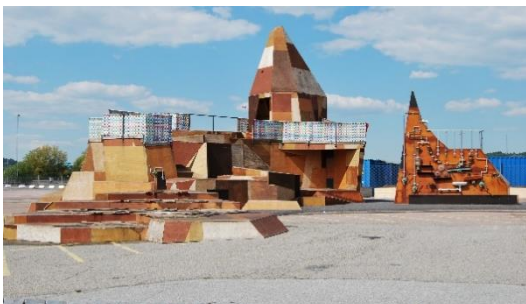
Figur 4. Lekplats med vattenkonst.