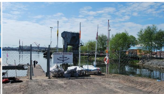
Figur 5. Bryggan ut till seglarskolan.