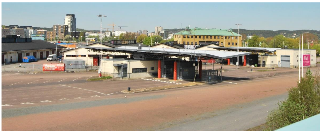
Figur 9. Frihamnen i Göteborg.

Från bron anas parkens lokalisering då karaktäristiska orangea markeringar för Älvstaden, en färg jag känner igen från olika hemsidor och dokument, syns en längre bit in i Frihamnen, synligt i Figur 9 . Uppe i vänstra hörnet syns den orangea markeringen. Från bron, visat i samma figur höger i bild, syns även en stor informationstavla med texten: "Hej! Här ska vi bygga ut Frihamnen i vårt nya, nära Göteborg". Inte från något håll finns Jubileumsparken med på några gatuskyltar för cyklister och gångtrafikanter, istället finns hänvisningar till Frihamnen. Ordet "Playan" sprayat på asfalten är det enda tecken jag hittar som hänvisning mot parken.