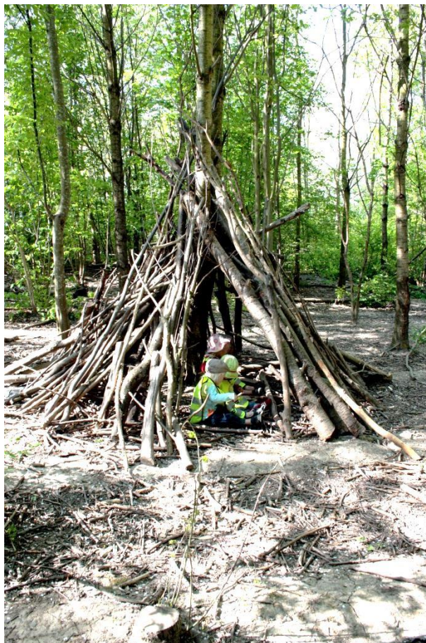
Figur 5.12 Observationsplats 2

Skogen består av planterade lövträd som bildat vad barnen kallar en skog. I efterhand har en del av träden i ett avgränsat område tagits bort och bildar nu en öppen yta med grenar, stubbar, pinnar, träd och buskar, där kojor byggs och förändras med tiden. Två kojor finns på platsen som barnen använder för att leka inuti, som på bilden ovan, eller som klätterställningar. Några barn bygger vidare på kojorna genom att hitta nya grenar på marken som kan läggas till på kojan. Alla barnen använder sig av pinnar eller grenar i leken, som de kånkar och släpar på. Pinnar mäts och jämförs med varandras. Runt den mer öppna ytan finns det buskar och gläntor som barnen undersöker. Barnen påminner varandra om att ta hänsyn till miljön, genom att påpeka att en inte får förstöra, eller vara försiktiga med träd och buskar som inte är lösa eller ligger på marken.