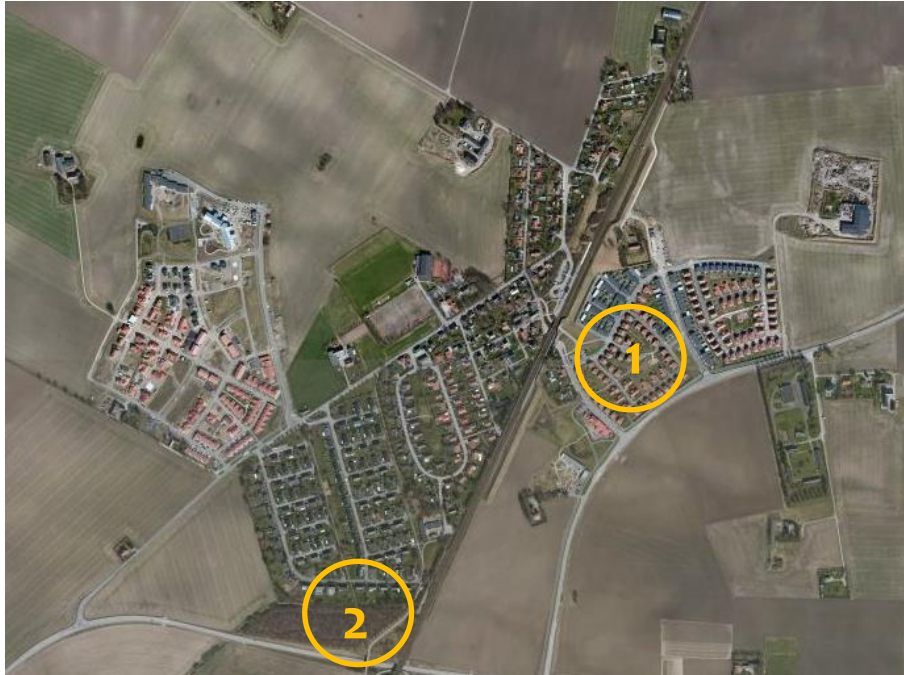
Figur 4.2 Observationsplatser

Val av plaster för observation är baserat på den tillgång till platser som existerar i dagsläget i Stångby. Urvalet baserades på en eftersträvan av ett brett spektrum kring naturelement och lekmöjligheter på platsen. Valet föll därmed på en lekplats på Stångbys östra sida och det som kallas för skogen på Stångbys västra sida, bland ursprunglig villabebyggelse. I övrigt är det två observationsplatserna olika vad gäller utformning och innehåll. Jag har vistats på dessa platser tidigare, det finns därför en medvetenhet om att se platserna ur barnens ögon, samt att dokumentera platsen innehåll och utformning som en studerande samhällsplanerare istället för en vikarierande förskollärare. Det är forskningsfrågan som styr insamling av data och information.