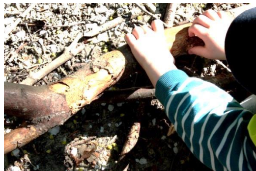
Figur 5.16 "Affordance"