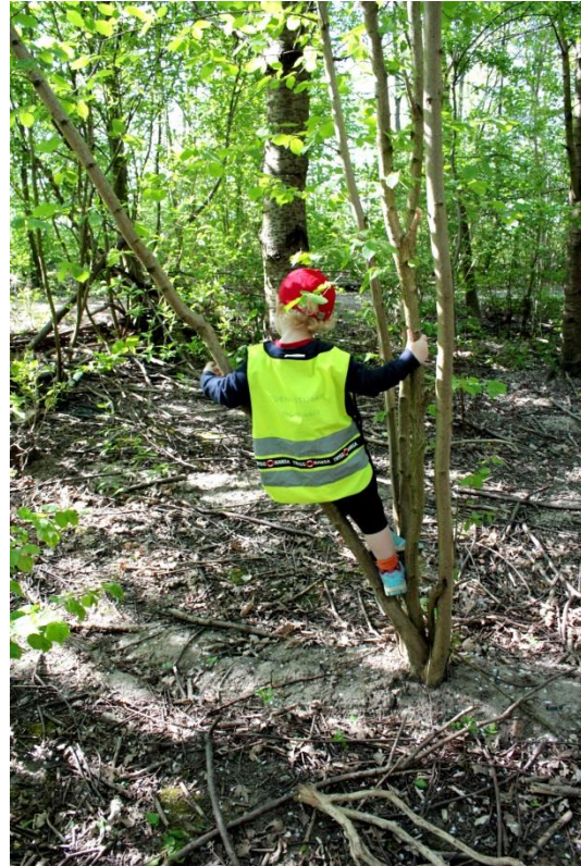
Figur 5.14 Att klättra

Underlaget på plasten är jord samt mängder med småpinnar, stubbar och stenar vilket skapar ett ojämnt markunderlag som utmanar barnen i rörelser och motorik. Bilderna ovan visar på hur barnen efter egen förmåga klättrar, balanserar och tar sig över hinder.