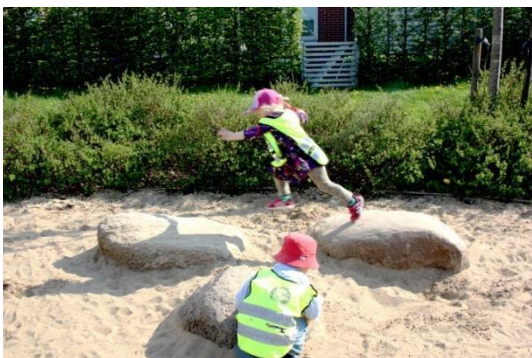
Figur 5.4 Stenar i ring

Bilderna ovan visar på två klassiska lekredskap, ett hus och en rutschkana. Huset är barnens förskola, för att sedan vara ett hus, "Här bor vi!", och några minuter senare en affär där barnen gör pannkakor. Leken förändras snabbt, en spade som finns på platsen är bidragande till att leken förändras. Rutschkanan används på olika sätt av barnen. De klättrar upp, några leker i huset där uppe, en del klättrar ner igen och några åker rutschkanan ner. Det finns två spadar på platsen, som ständigt används, inte enbart genom att gräva utan också som ett föremål i leken att exempelvis göra pannkakor.