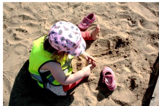
Figur 5.8 Att känna med fötterna