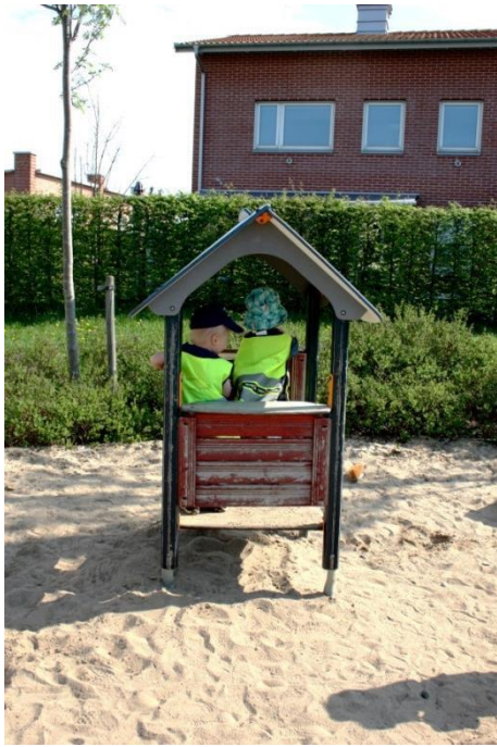
Figur 5.2. Hus