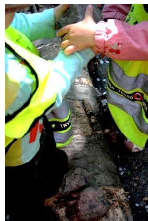
Figur 5.19 Att samsas i en lek