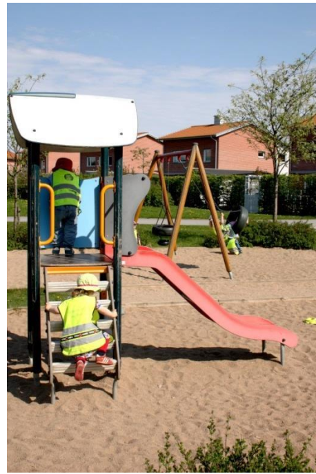
Figur 5.3 Rutschkana

Bilderna ovan visar på två klassiska lekredskap, ett hus och en rutschkana. Huset är barnens förskola, för att sedan vara ett hus, "Här bor vi!", och några minuter senare en affär där barnen gör pannkakor. Leken förändras snabbt, en spade som finns på platsen är bidragande till att leken förändras. Rutschkanan används på olika sätt av barnen. De klättrar upp, några leker i huset där uppe, en del klättrar ner igen och några åker rutschkanan ner. Det finns två spadar på platsen, som ständigt används, inte enbart genom att gräva utan också som ett föremål i leken att exempelvis göra pannkakor.