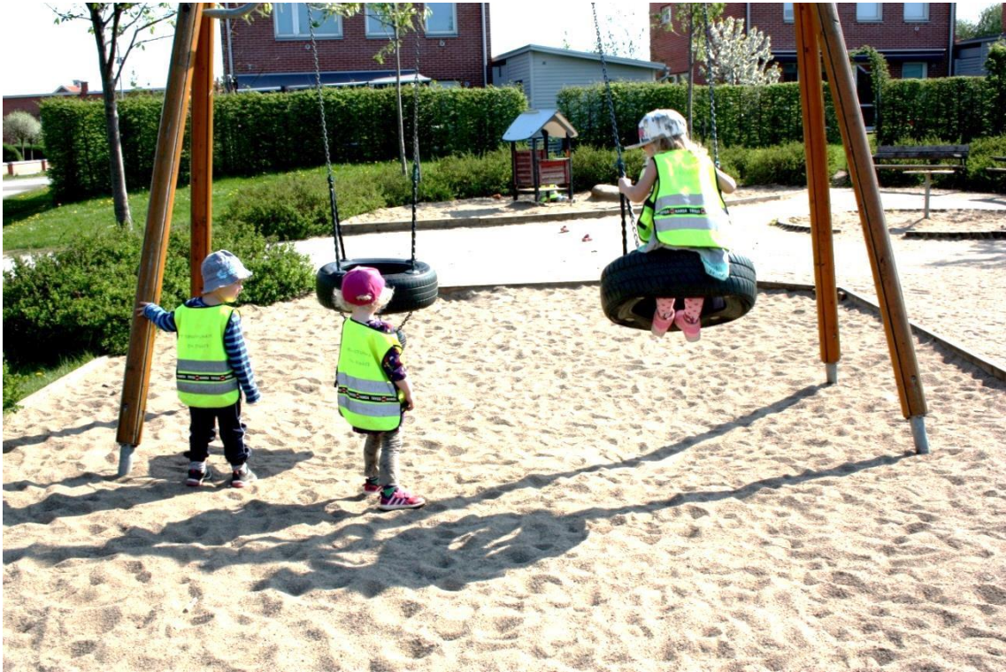
Figur 5.6 Gungor - hinder för självständig lek eller utmanande?

Det finns två gungor på platsen, många av barnen behöver hjälp av vuxen för att komma upp i gungan. Barnen blir pushade till att försöka själva, en flicka försöker länge att klättra upp på egen hand. När hon tillslut lyckas går inte stolheten och glädjen att gå miste om. Rutschkanan och gungorna används hela tiden av något av barnen, men de områden som samlar flest barn tillsammans under en längre stund är området runt stenarna med huset och gröningen med backen. En flicka sitter och känner på sanden med händerna för att sedan ta av sig skorna och undersöka sanden vidare, genom att hålla sanden på fötterna, se nedan. En pojke letar efter en magisk sten.