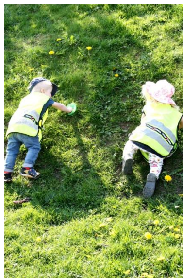
Figur 5.11 Att utmanas av branta backar