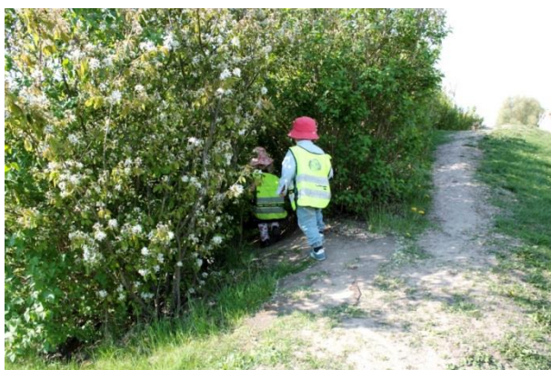
Figur 5.10 Att hitta nya stigar