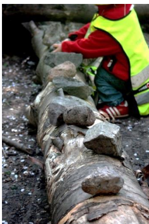
Figur 5.18 Att lägga stenar i rad

En pojke leker länge med långa grenar och pinnar som han hittar och lägger på ett utvalt ställe. Under en stund samlar han ihop och drar grenarna längs marken, för att sedan använda materialet som trummor medan han sjunger. Därefter sitter han länge och undersöker grenens bark, han tar bort, pillar och känner vad som finns under. Leken förändras återigen då han "gör ett land" och lägger grenarna i ett särskilt mönster. Syftet med grenarna förändras under pojkens lek, grenen är ett föremål som medför flera användningsalternativ. Några andra barn hittar stenar som de lägger i rad på en stock. Barnen som sysselsätter sig med detta förändras, några börjar göra något annat och andra kommer till. Stenarna flyttas bort, byter platser och läggs till.