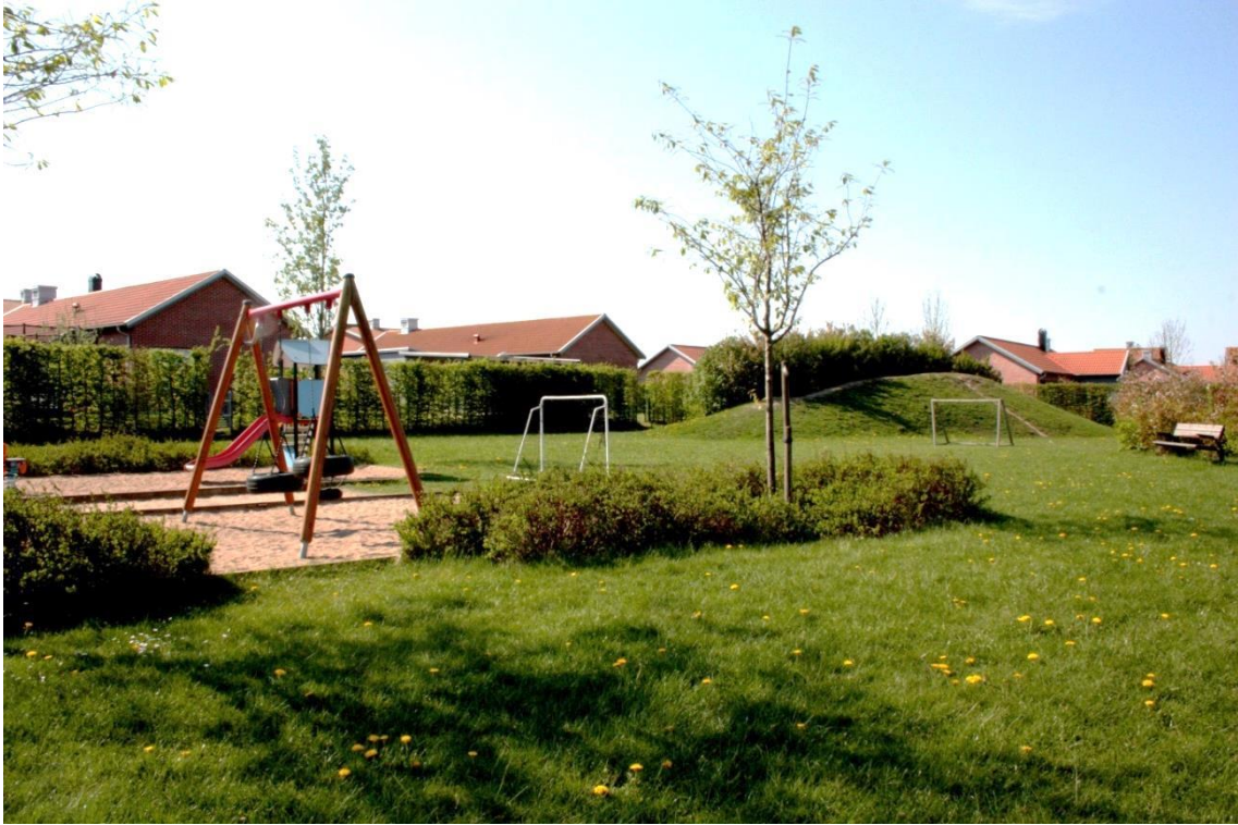
Figur 5.1 Observationsplats 1

Lekplatsen är placerad centralt i bostadsområdet på Stångbys östra sida och är omringad av radhus med tillhörande trädgårdar samt cykel- och gångväg. På lekplatsen finns fyra sektioner med lekredskap; rutschkana och två gunghästar, två gungor, en cirkelformad sandlåda med upphöjd kant med ett bord i mitten samt ett hus med tre stora stenar intill. I anslutning till lekplatsen finns en grönyta med två fotbollsmål av mindre storlek samt en relativt brant backe. På bilden syns rutschkanan, gungorna samt grönytan med tillhörande backe. Buskar skapar stigar bakom backen. Underlaget på platsen är blandat; sand, småsten och gräs. Det finns även buskar och träd utplacerat samt bänkar och en papperskorg. Barnen leker varierat med olika lekredskap. Några barn stannar längre vid en sektion, andra byter ofta.