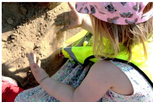
Figur 5.7 Att känna med händerna

Det finns två gungor på platsen, många av barnen behöver hjälp av vuxen för att komma upp i gungan. Barnen blir pushade till att försöka själva, en flicka försöker länge att klättra upp på egen hand. När hon tillslut lyckas går inte stolheten och glädjen att gå miste om. Rutschkanan och gungorna används hela tiden av något av barnen, men de områden som samlar flest barn tillsammans under en längre stund är området runt stenarna med huset och gröningen med backen. En flicka sitter och känner på sanden med händerna för att sedan ta av sig skorna och undersöka sanden vidare, genom att hålla sanden på fötterna, se nedan. En pojke letar efter en magisk sten.