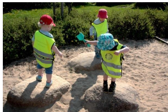
Figur 5.5 Att hoppa och att samsas

De flesta barnen testar att hoppa från stenarna och runt i ring. Barnen visar hänsyn till varandra och hejar på varandra och vill gärna att någon ska uppmärksamma att barnet i fråga klarar att hoppa själv. Ibland är det ett barn som hoppar och ett annat barn tittar på. Under en stund är det tre barn och tre stenar. Efter en del krockar och snubblingar löser barnen det genom att ropa på varandra, "akta dig" här kommer jag!" "nu är det jag!", vilket syns i Figur 5.5.