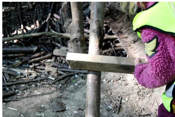
Figur 5.15 Att skapa ljud

I skogen finns det föremål och element som skiljer sig från observerad lekplats. Med stora grenar och andra material krävs det även av barnen att de har uppsikt över kompisar i närheten. En sysselsättning som uppstår under flera tillfällen är att testa ljud. Barnen använder sig av olika typer av redskap och underlag för att testa vilket ljud som uppstår. ”Vi hyvlar”, ”vi bankar!”, ”jag sågar”, ”det är trummor”.