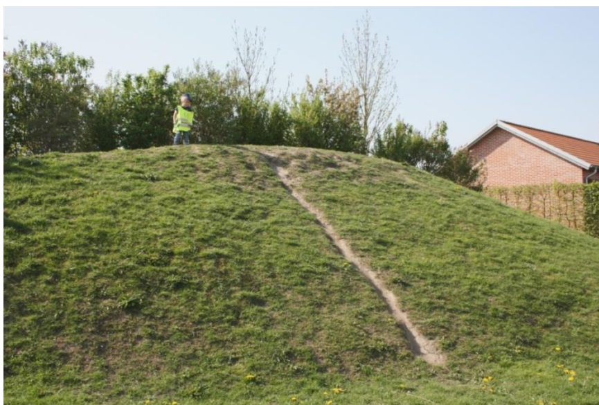
Figur 5.9 Att ta egna initiativ

Lekplatsen är även förankrad till ett grönområde med en backe. Det är speciellt en flicka och två pojkar som vistas runt backen under en längre period, men deras lek smittar även av sig på andra barn. Det är en av pojkarna som på eget initiativ tar sig upp för backen. Flickan hittar stigarna bakom och vill undersöka var på den andra pojken hänger på och vill testa. Buskagen med små stigar och gömställen bildar en spännande miljö som barnen upptäcker. Barnen testar olika möjligheter för att klara av leken eller aktiviteten på egen hand. Backen är brant för barnen men de testar sig fram för att komma ner, efter ett antal försök kasar några barn ner på rumpan. Fotografierna visar på det egna initiativet, stigarna i buskarna som hittades och hur barnen testar olika lösningar för att ta sig upp och ner för backen.