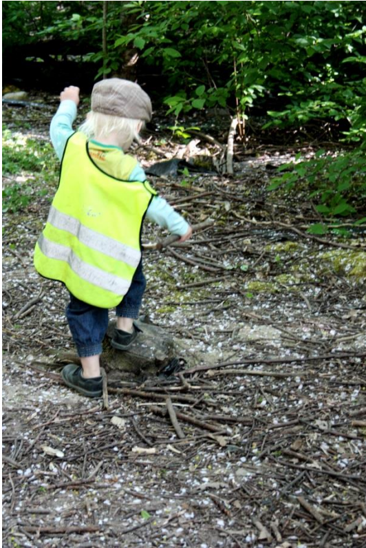
Figur 5.13 Att balansera