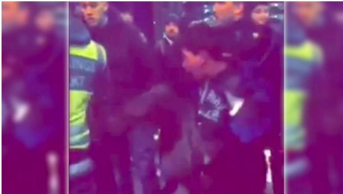
Här ser vi nioåringen sparka en väktare i ryggen.