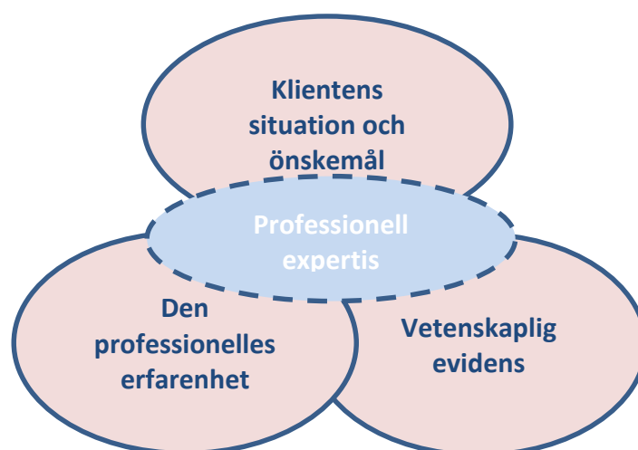
Figur 2. Vår illustration av EBP-modellen.