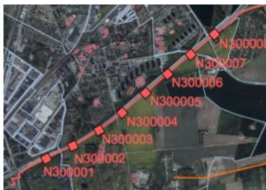
Delsträcka av elnätet till elvägen mellan Malmö och Lund med utsatta nätstationer

motsvarande 10 km. Det är mer samhällsekonomiskt att bygga elväg för både tung trafik och personbilar, då fler har möjlighet att utnyttja vägen. Investeringskostnaden för elnätet i det stora scenariot uppgick till drygt 1,7 miljoner SEK / km. Själva elvägen kan kosta runt 3 miljoner SEK / km i framtiden om den byggs ut i stor skala. En viktig slutsats är även att elnätsnätskostnaden understiger energikostnaden per km, för en personbil, och sätter därför inte käppar i hjulet för byggnation.