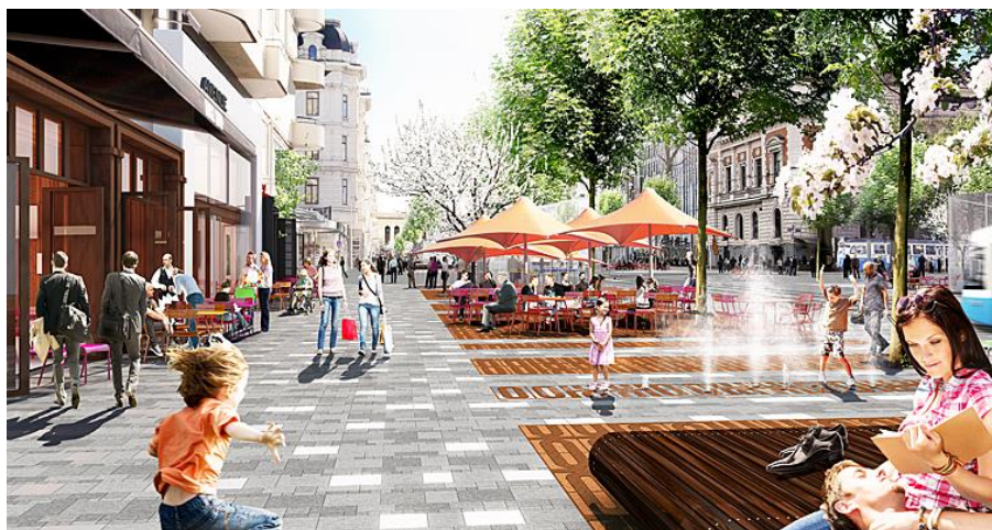
Bild 5. Exempel på visionsbild, Göteborgs stad, 2015