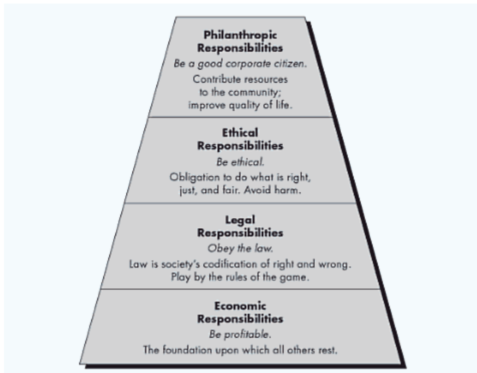
Figur. 1 Carrolls pyramid av CSR

Archie B. Carroll, professor emeritus, är som nämnt en av de mest framstående inom forskningen av CSR. "Carroll's Pyramid" är en av de modeller om vad CSR är och hur det bör implementeras som faktiskt används i praktiken av stater, organisationer och företag. Pyramiden består utav fyra ansvarsområden som bör uppfyllas av företagen; ekonomi, juridik, etik och filantropi. 17