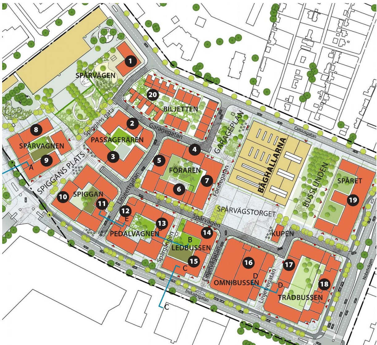
Map. 3 The block Spårvägen in the new district Norra Sorgenfri and