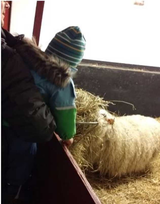
Figur 4. Gunnesbo 4H-gård. Vid tidpunkten för fotograferingen är det fullt fokus på fåren som precis fått hö under djurmatningen.