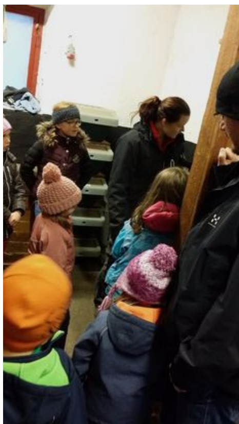
Figur 10. Besökare som lyssnar på en ledare på Almviks 4H-gård.