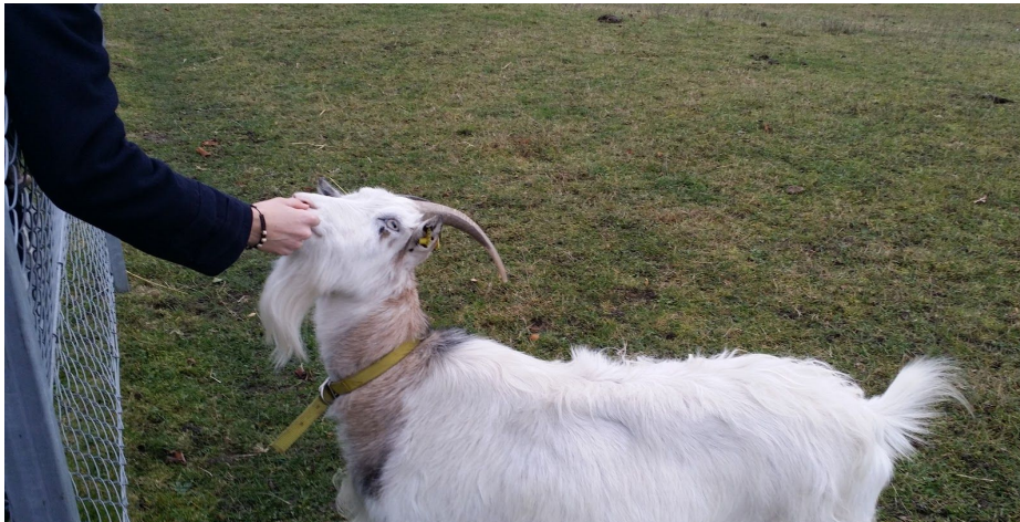
Figur 17. Ett direkt möte mellan människa och djur på Almviks 4H-gård.