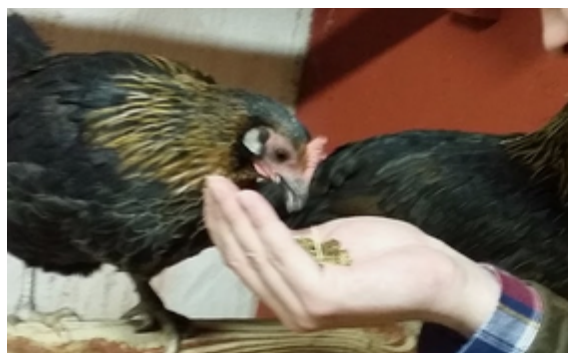
Figur 6. En höna på Gunnesbo 4H-gård som får plocka frön ur handen på en besökare.