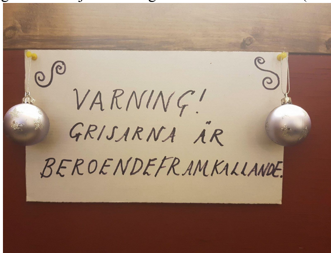
Figur 18. En varningslapp som sitter vid grisarna på Gunnesbo 4H-gård.