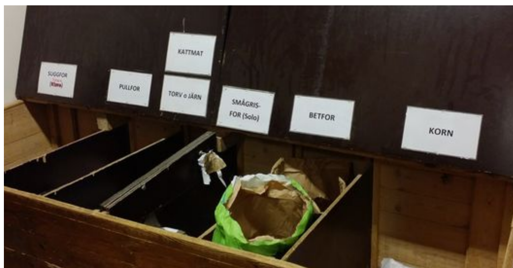
Figur 9. En del av foderrummet på Almviks 4H-gård.

För att lära barnen om naturliga processer när det kommer till djur använder sig 4H:s ledare mycket av att prata om djurens behov och hur de lever. De förklarar olika saker om djuren för barnen, ofta sådant som har med naturliga processer att göra. Detta kan t.ex. innebära vad konsekvenserna blir om vi människor slutar ta hand om djuren, att de faktiskt kan dö om vi glömmer ge dem mat eller vatten. Mia förklarar: