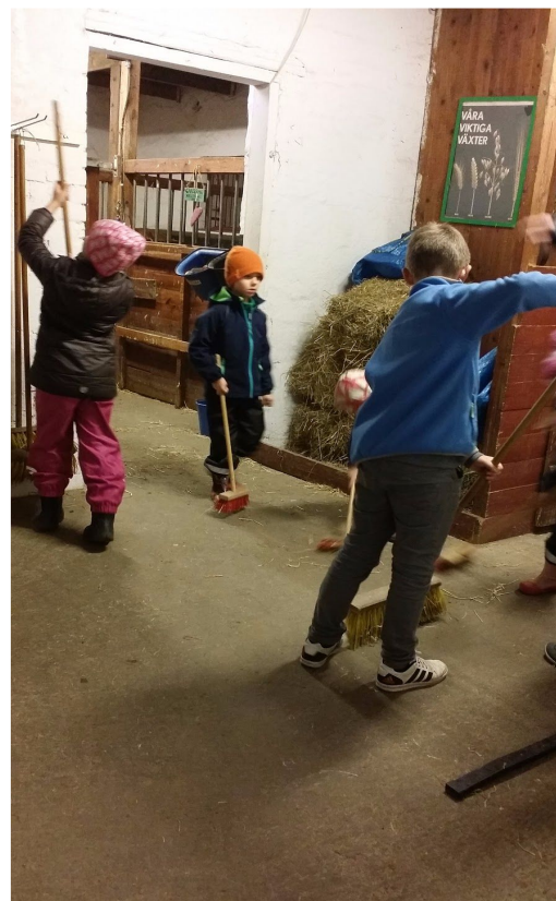
Figur 11. Samarbete mellan flera barn på Almviks 4H-gård.