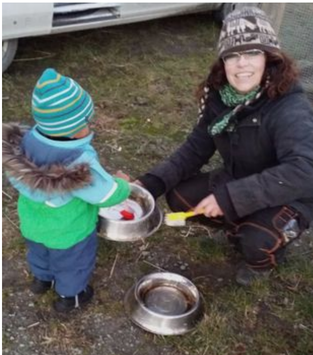
Figur 7. Barn som får lära sig diska, Gunnesbo 4H-gård.

Att barnens handlingar gentemot djuren spelar roll, och att de därför är en del av någonting större i enlighet med Heideggers "Dasein" om att allting hänger ihop, får barnen lära sig genom att göra, genom interaktionen med djur på 4H-gårdarna. Om barnen förstår att djur är kännande varelser, samt lär sig att det finns en slags orsak-verkanrelation, alltså att deras handlingar gentemot djuren spelar roll, så kan en djupare förståelse för innebörden av de egna handlingarna utvecklas. Detta sträcker sig även till andra människor. Eftersom verksamheten är uppbyggd kring att alla samarbetar lär sig barnen vad det innebär att även ha respekt för andra människor. Detta gör att de kan förstå att deras livsvärld hänger ihop med andras, att vad de gör direkt eller indirekt spelar roll för andra (Ingold 2011). Barnen lär sig även om ansvar när de t.ex. förstår att det är viktigt att ge djuren rätt mängd mat, att denna handling är viktig för någon annan än de själva. I ett mer långsiktigt perspektiv skulle detta kunna innebära att det ger förutsättningar för en ekologisk identitet att bildas enligt Thomashows (1995) tes, eftersom detta gör att barnen i en tidig ålder och på ett grundläggande plan lär sig att de ingår i ett större system.