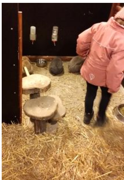
Figur 5. Almviks 4H-gård. En flicka som fått hålla en kanin för första gången.

Eller vi har en tam höna som jag brukar ta fram, hon är helt fantastisk, det är min älskling...hönsen är mina favoriter! Och liksom, gud, kan man klappa en höna? Kan man ha den uppe? Kan man göra det med en get? Ja, det kan man.. om man ger det tid och energi. Så kan man göra det, så är det väldigt många barn som verkligen blir till sig av glädje.