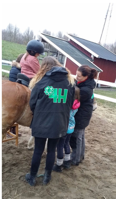
Ponnyridning med hjälp av äldre personer - till vänster på Gunnesbo 4H-gård och till höger på Almviks 4H-gård.