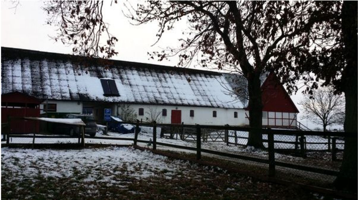
Figur 2.

Det finns även odlingslådor på gårdsplanen som används för att lära barnen om växter, främst ätbara. Dessa används under vissa årstider, främst under våren och sommaren. Gunnesbo 4H-gård har ett kaninstall där det finns både privatägda kaniner samt kaniner som tillhör gården, medlemmar kan hyra burar för kaniner. Detta ger barn möjlighet att ha en kanin och rå om den på gården istället för hemma. Föräldrarna och barnen får skriva på ett kontrakt om att kaninen ska ses till varje dag, få ny mat och vatten etc. Om detta inte är möjligt alla dagar erbjuder gården att passa kaninen för 10 kronor per dag ( gunnesbo4h.se/kaninstall ).