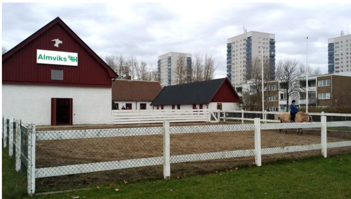
Figur 1. Almviks 4H-gård.

En av gårdarna jag har valt att inkludera i denna undersökning heter Almviksgården och ligger i Malmö (Figur 1). Gården kallas även "4H-gården mitt i stan". Almviksgården började brukas som bondgård i början av 1800-talet och hölls i bruk till och med år 1971. Den stod sedan tom till år 1976 när Fritid Malmö startade Almviks djurfritidsgård, som numera är Almviks 4H-gård. Målet var, och är, enligt Almviks 4H-gård att barnen ska få lära sig hur en svensk lantgård fungerar och vilka djur som finns, samt hur de ska skötas. På gården finns två hästar, en ko, grisar, katter, får, getter, en tupp, tio hönor och kaniner ( www.4h.se/almvik/ ).