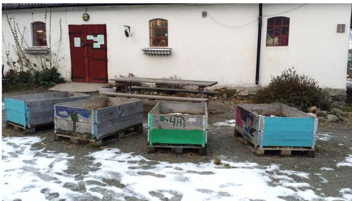
Figur 12. Några av odlingslådorna på Gunnesbo 4H-gård som står tomma för vintern vilket innebär att de inte användes vid tidpunkten för undersökningen.

Genom att barnen på 4H-gårdarna får lära sig genom att göra märker de att vad de gör spelar roll, det kan handla om allt från en potatis som de sätter och efter en tid kan skörda till att mata grisen. När barnet satt potatisen får handlingen mening vid skörden när barnet ser att det vuxit fler potatisar, dessutom ger det kunskap om den naturliga process det innebär för en potatis att sättas, växa upp till en planta osv.