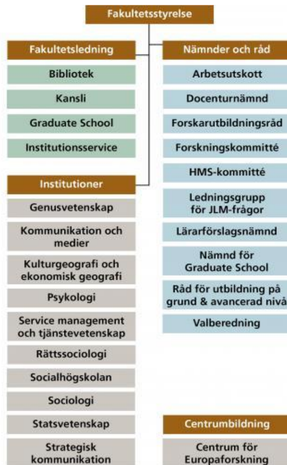
Figur 2: Samhällsvetenskapliga fakulteten ordning och ledning.

Fakultetsstyrelsen är det organ institutionsstyrelserna sorterar under och ska rapportera vissa beslut till. Institutionsstyrelserna kan även vända sig till fakultetsstyrelsen för att få råd och med frågor. Statsvetenskapliga institutionen är en av tio institutioner och en del av samhällsvetenskapliga fakulteten (Arbetsordning för Lunds Universitet, 2017).