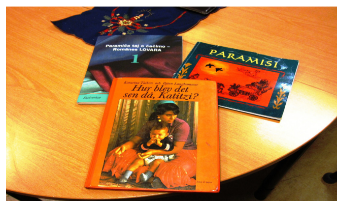
Böcker som används i undervisningen.