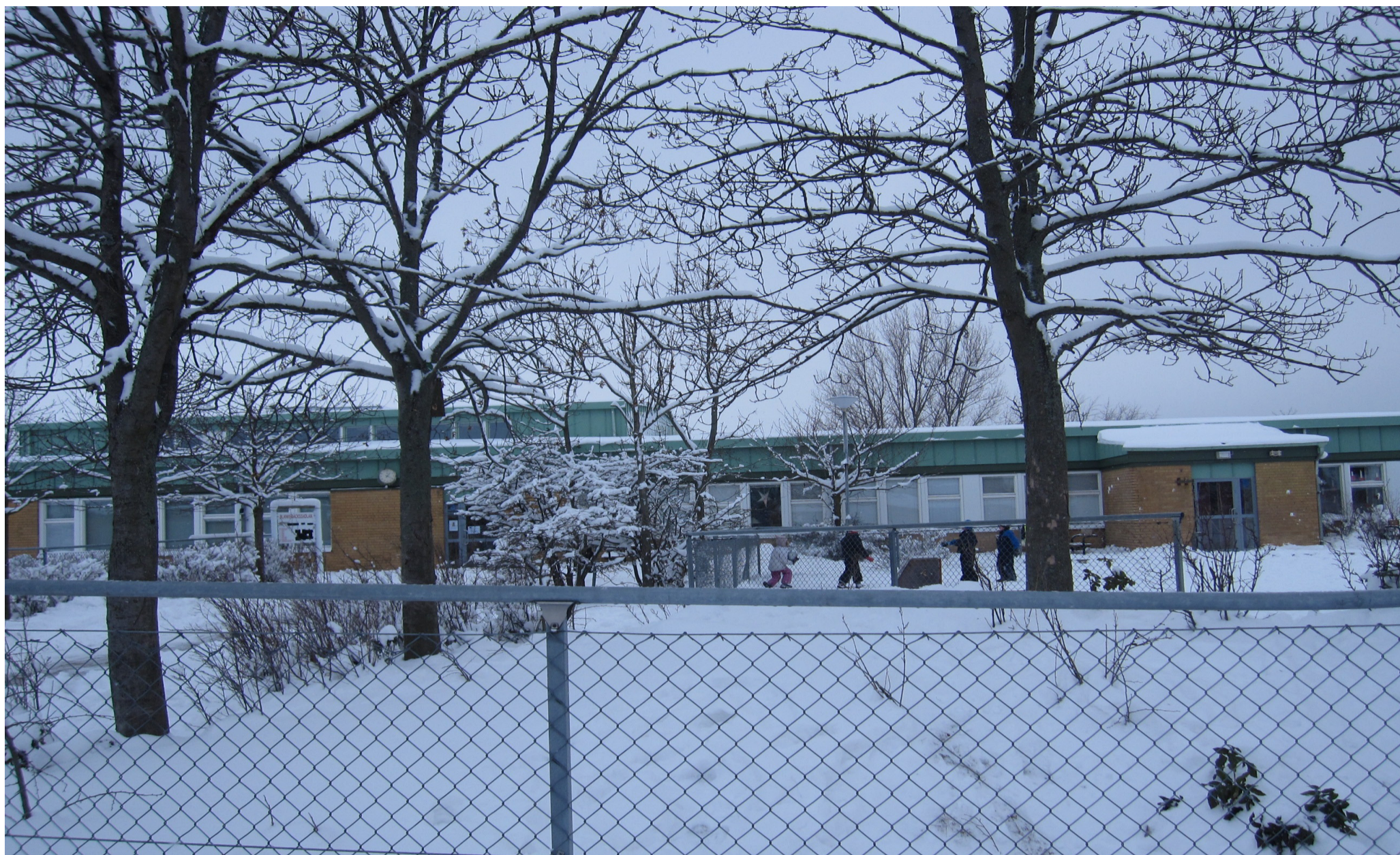
Blankebäcksskolans romska elever är inte många men de går alla än så länge på modersmålsundervisning i romani.