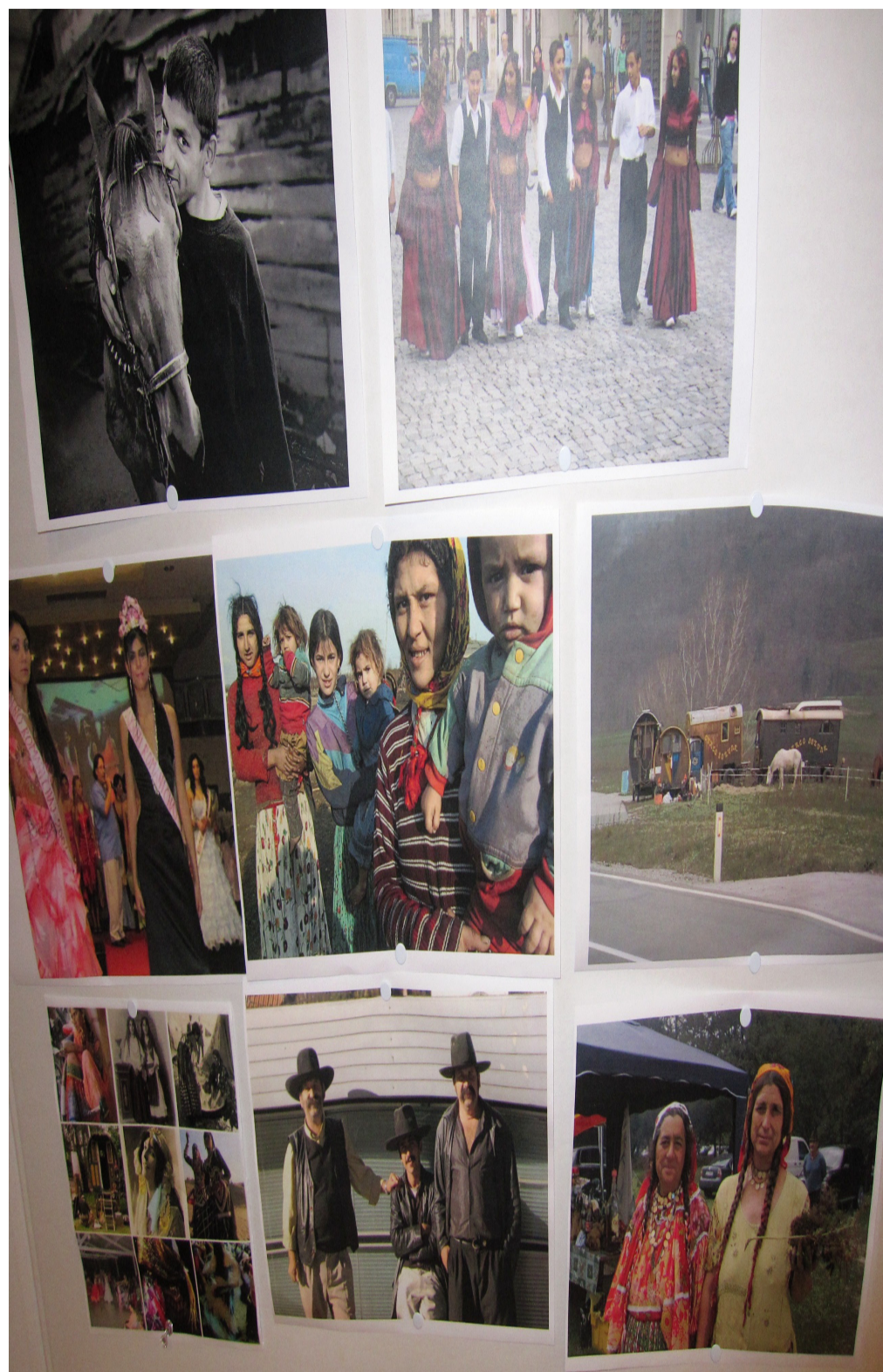
Romernas livsstil skiljer sig åt mellan olika grupper.

– Varför ska gemene man ha rätten att ha en negativ uppfattning om mig? Vi säger inte: Älska alla romer! Det är inte det vi står för. Men vi säger: ändra attityden mot kollektivet.