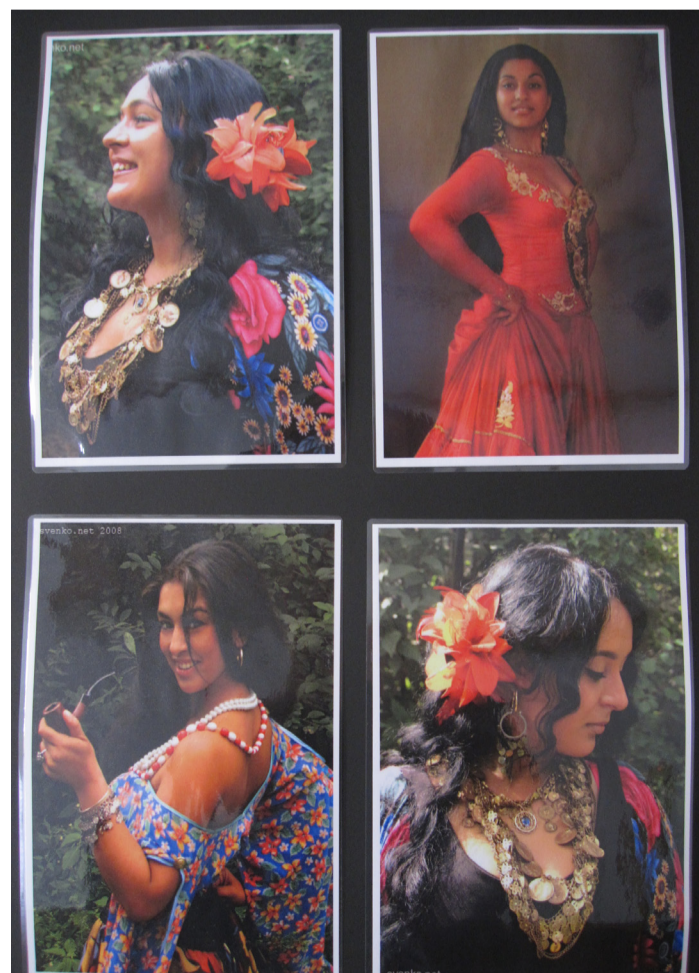
På RIKC hänger planscher som påminner om personalens bakgrund.

RIKC:s lokaler är lite undanskymda, de ligger i en egen korridor vid sidan av biblioteket. Ena