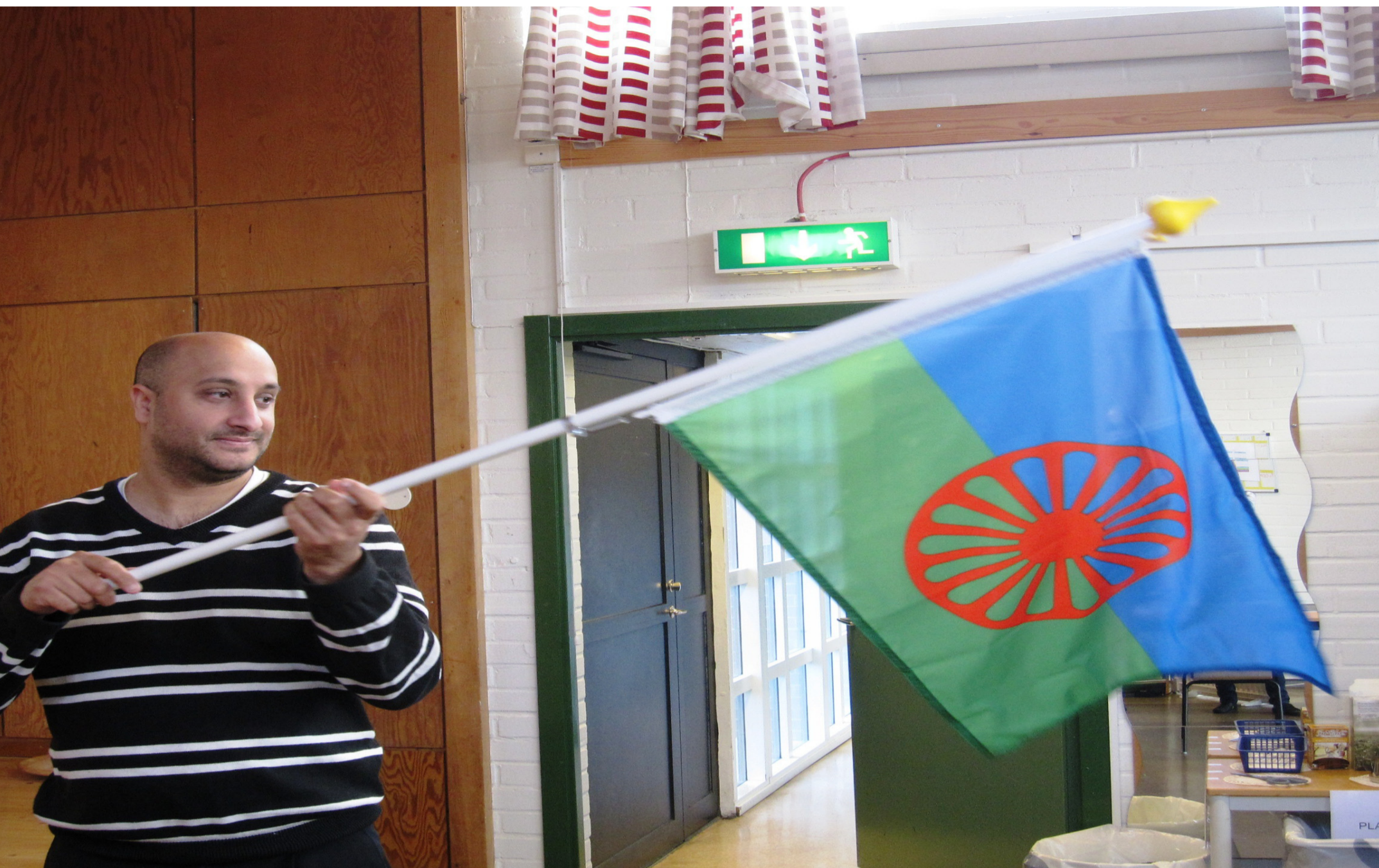
Vävström håller stolt upp den romska flaggan. Den antogs 1971 och det röda hjulet symboliserar romernas ursprung i Indien