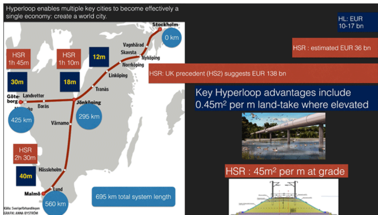
Figur 3: Case study: Hyperloop i Sverige

Den här figuren visar förslag på Hyperloop-förbindelser i Sverige och valet av linjerna kommer på bakgrund av vad utredning av Sverigeförhandlingen för höghastighetståg i Sverige har föreslagits. Prisskillnaderna och tiden det tar att nå de olika städerna från Stockholm visas i blått för Hyperloop och rött för höghastighetståg.