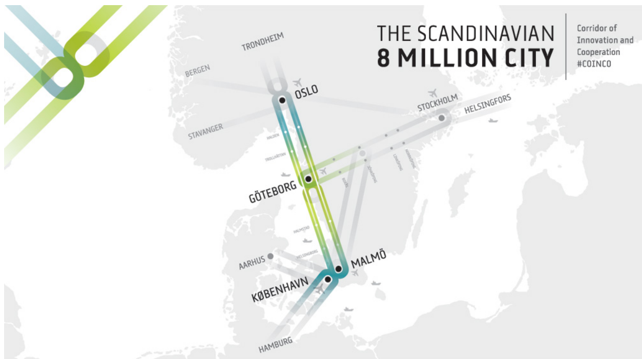
Figur 1: The Scandinavian 8 Million City

Figuren visar ett förslag på hur Köpenhamn, Malmö, Göteborg och Oslo kan komma att se ut som en stor internationell region. Figuren visar även närheten till andra centrala städer som Stockholm, Helsingfors, Aarhus och Hamburg.