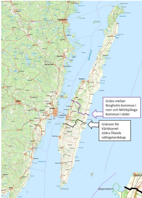
Öland med kommungräns och gränsen för Världsarvet södra Ölands odlingslandskap utmärkt.