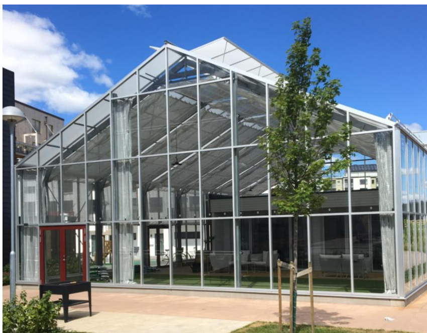
Bild 2: Fellehuset "Initiativet".

I fellehusen planeras för övernattningsrum och vistelserum som är bokningsbart av kvarterets boende (Intervju. Boende 2018-07-09).