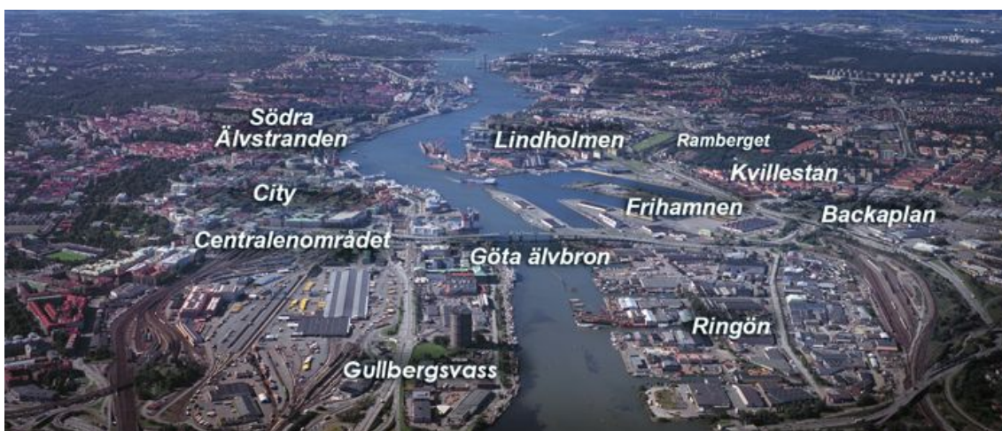
Figur 1. Denna karta visar de områdena i Göteborg som ska ingå i Älvstaden. Kanalen i mitten är Göta Älv och Hisingen är marken till höger om älven. Vad som i denna karta kallas Kvillestaden är Kvillebäcken (Hämtad 13-01-19. Centrala Staden. http://www.centraalvstaden.goteborg.se/ ).

Göteborg karaktäriserades länge av de stora hamn- och varvsverksamheterna som under merparten av 1900-talet sysselsatte en stor andel av Göteborgs befolkning. Även industriverksamheterna Volvo och SKF etablerades i Göteborg under första hälften av 1900-talet och satte sin prägel på staden som industristad och under efterkrigstiden växte Göteborgs fartygsvarv upp till att bli stora. Under 70-talets varvskris drabbades Göteborg hårt och skeppsvarven Götaverken, Lindholmen och Eriksbergs, som låg på norra älvstranden minskade i betydelse och försvann nästan helt ur näringslivet (Mehner, Göteborgs Stad).