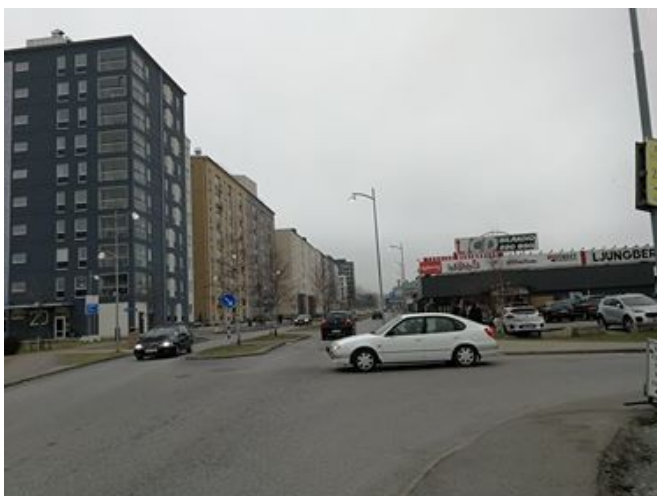
Figur 3. Fotot visar gränsen mellan Nya Kvillebäcken och gamla Kvillebäcken. De höga byggnaderna till vänster i bilden tillhör Nya Kvillebäcken och macken till höger i bilden tillhör gamla Kvillebäcken.

arkitektur. Därför går den upplevda differentieringen mellan Nya Kvillebäcken och omkringliggande område och Hisingen i linje med Visionen. På bilden nedan går det tydligt att se gränsen mellan Nya Kvillebäcken och omgivningen.