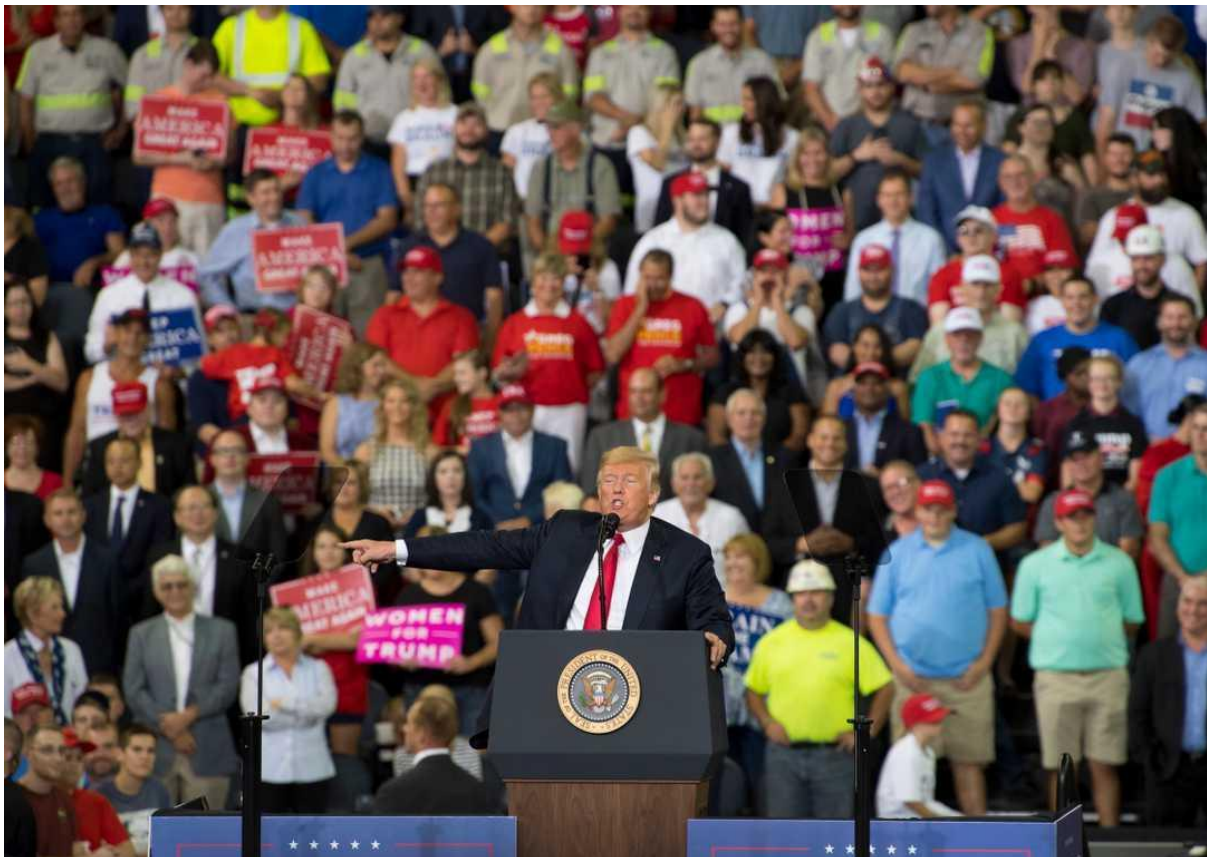
President Donald Trump addresses his supporters at his campaign rally at the Ford Center in Evansville, Ind., Thursday night.