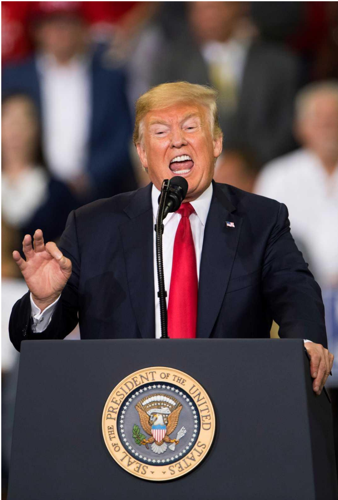
President Donald Trump addresses his supporters at his campaign rally at the Ford Center in Evansville, Ind., Thursday night.

is an incredible economy, where employers need people. And for the first time ever, really — and we have a lot of great programs to help — for the first time ever, employers are hiring prisoners. They're getting a second and, in some cases, a third chance.