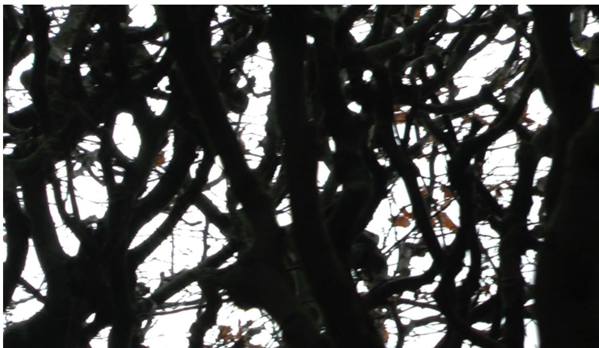
Bild från Åsa Wirrling film till Kling klang tagen en februaridag i Pildammsparken i Malmö.