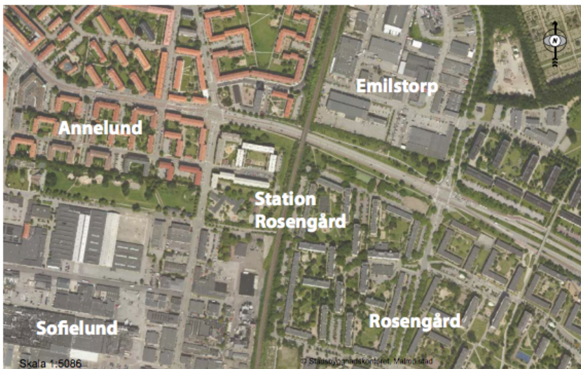
Figur 3. Amiralstaden's geografiska rum. Amiralstaden ligger i Malmö och utgår från Station Rosengård (Malmö stad, 2018:6).

livsmiljöer för barn och vuxna. I planeringsprocessen har projektledarna bjudit in fastighetsägare, näringsidkare, verksamheter, föreningar och Malmöbor till att vara med i dialoger och samarbeten för att utveckla området. Som metod för en mer socialt hållbar stadsplanering arbetar Malmö stad, i projektet Amiralstaden, med så kallade kunskapsallianser. Dessa ska, tillsammans med de fysiska resultaten, bidra till att nätverk bildas, underlättas och underhålls. Områdets infrastruktur ska på så vis underlätta för kontakter och att stråk kopplas samman och undviker att skapa fysiska och mentala barriärer (Ibid).