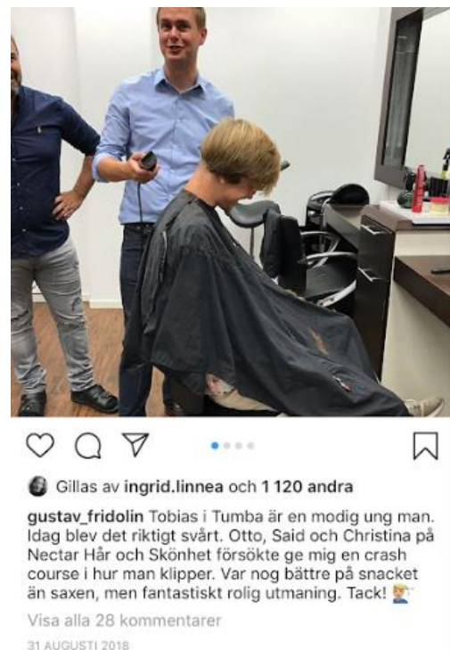
Figur 4: Bild från Gustav Fridolins Instagram.