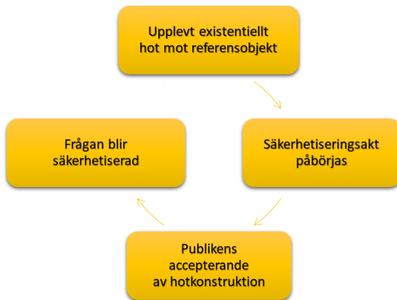
Figur 2. Säkerhetsiseringsprocessen