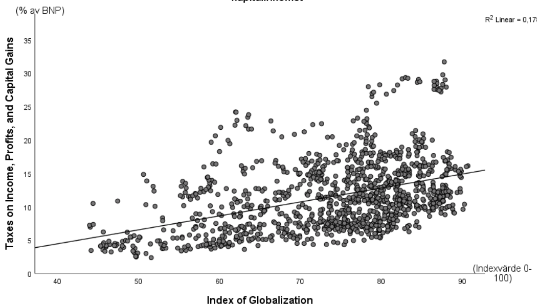
Spridningsdiagram över samvariation mellan globalisering och skatter på inkomst, vinst och kapitalinkomst