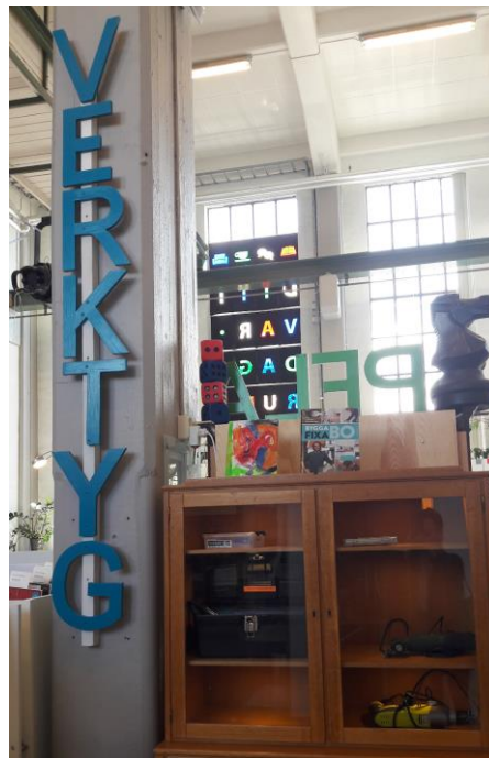
Figur 2 Verktygsutlåning på ett bibliotek.

som specifikt behandlar bibliotek i relation till delningsekonomi är dock fortfarande mycket begränsad (Söderholm 2018). Söderholm har skrivit en avhandling baserad på fallstudier av amerikanska bibliotek. Även om en del av dessa har varit folkbibliotek med verktyg som en del av sitt utbud har de flesta varit privata initiativ som endast erbjuder utlåning av verktyg, något som är relativt vanligt i USA. Det är relevant att undersöka de unika förutsättningar de svenska biblioteken har, exempelvis med tanke på den kombination av kollektivism och individualism som finns i den svenska kulturen (Daun 1991). Detta arbete bidrar med nya perspektiv till forskningen genom att med utgångspunkt i att en omställning av människors konsumtionsmönster av miljöskäl är nödvändig fokuserar på praktiska lösningar genom att undersöka detta fenomen ur bibliotekariers perspektiv.