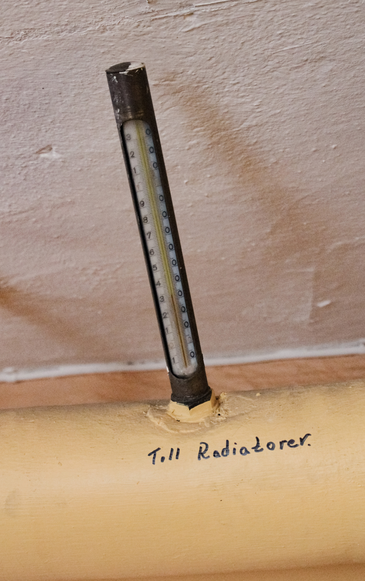
Kontrolltermometer i källaren (T.V)