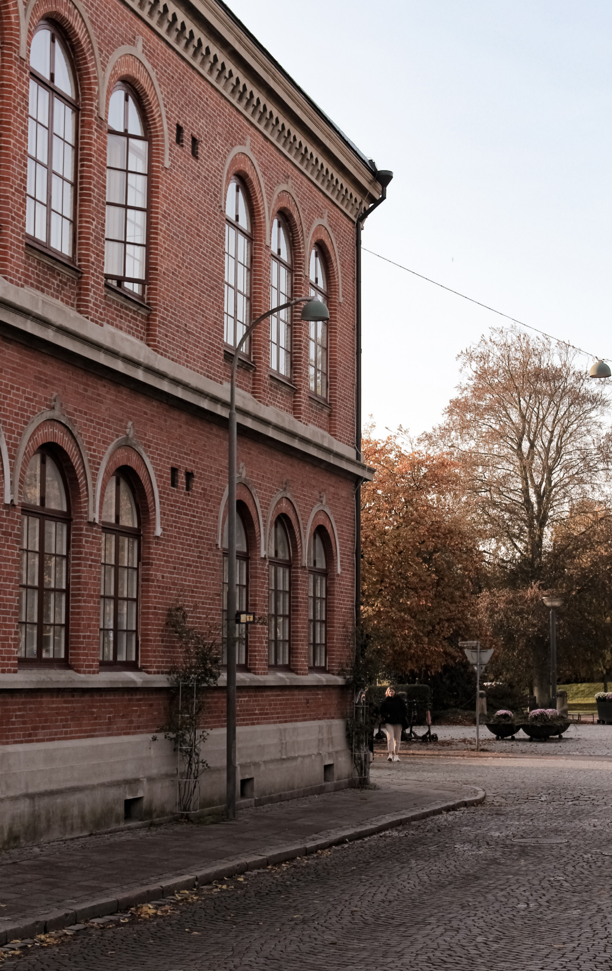
Nygatans slut mot Stadsparken med Parkskolans tegelfasad (T.V.)