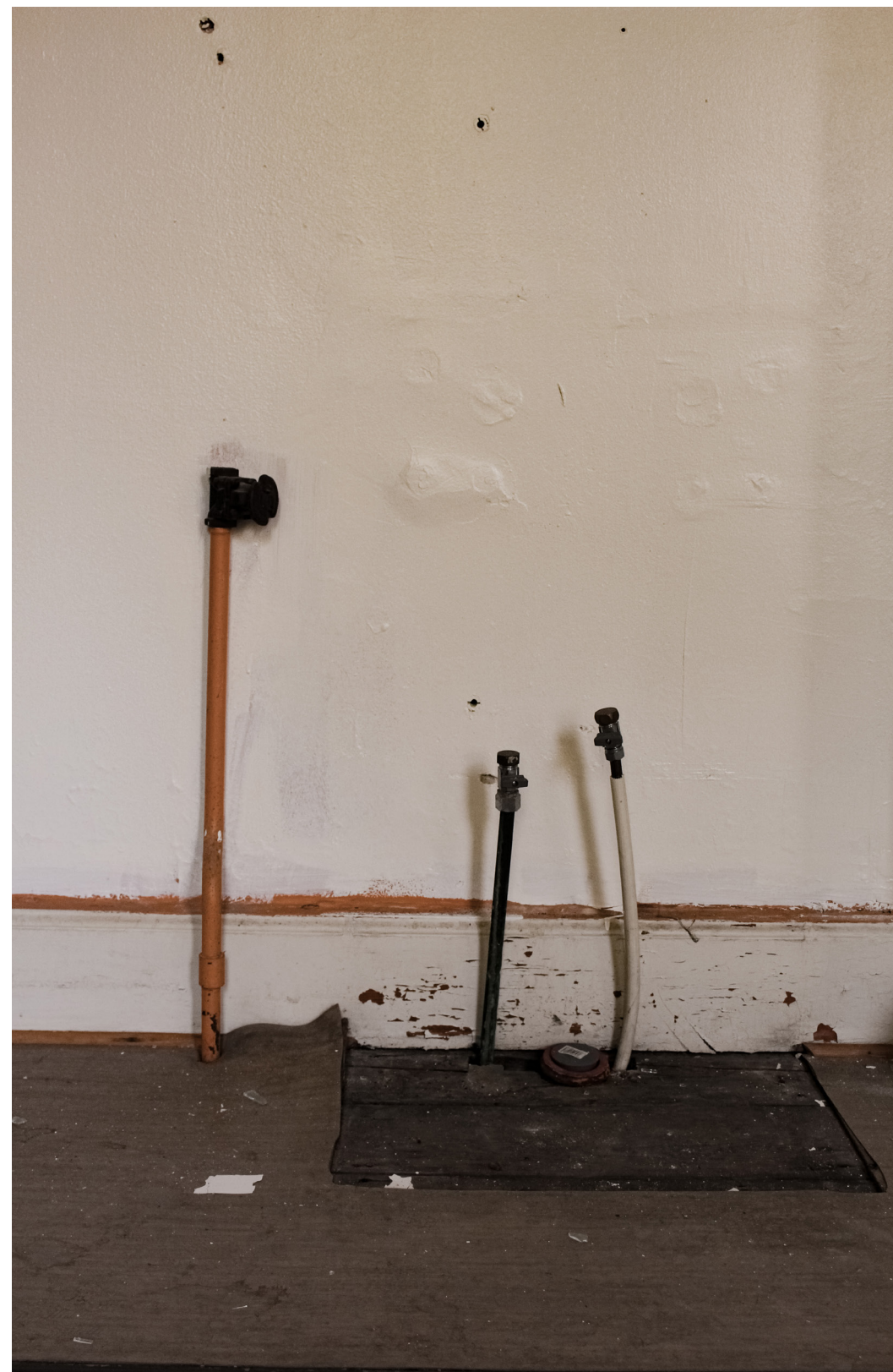
Installationspunkter i Norra flygeln (T.H)