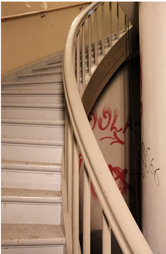
Trappa som sträcker sig tre våningar (T.V)