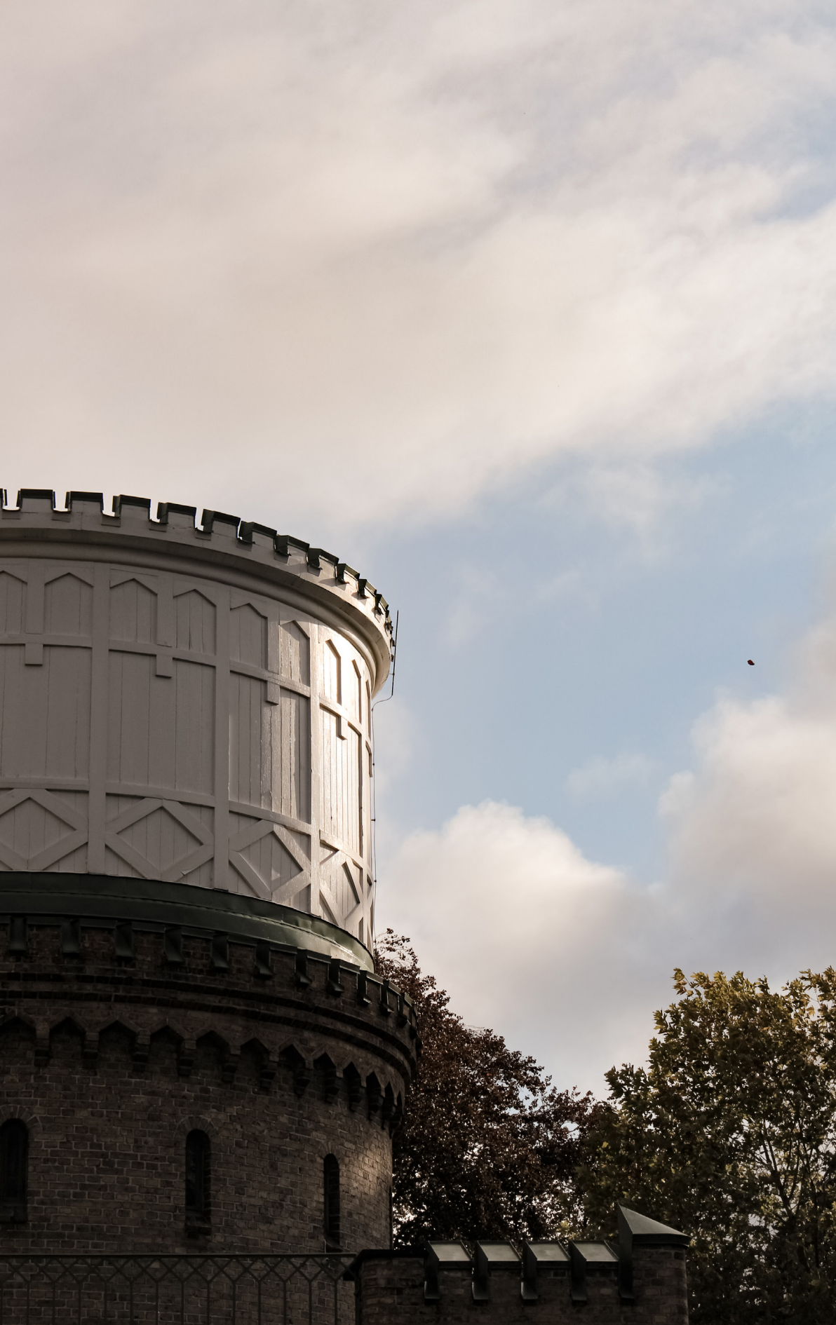
Observatoriets kupol i tidig höstsol