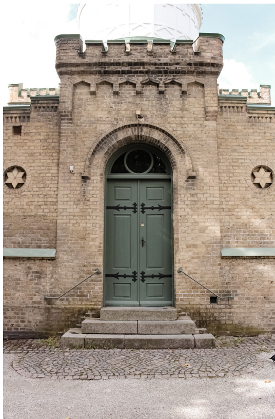
Huvudentrén och dess få, men välvalda ornamentering. Välkommen till Lunds gamla Observatorium