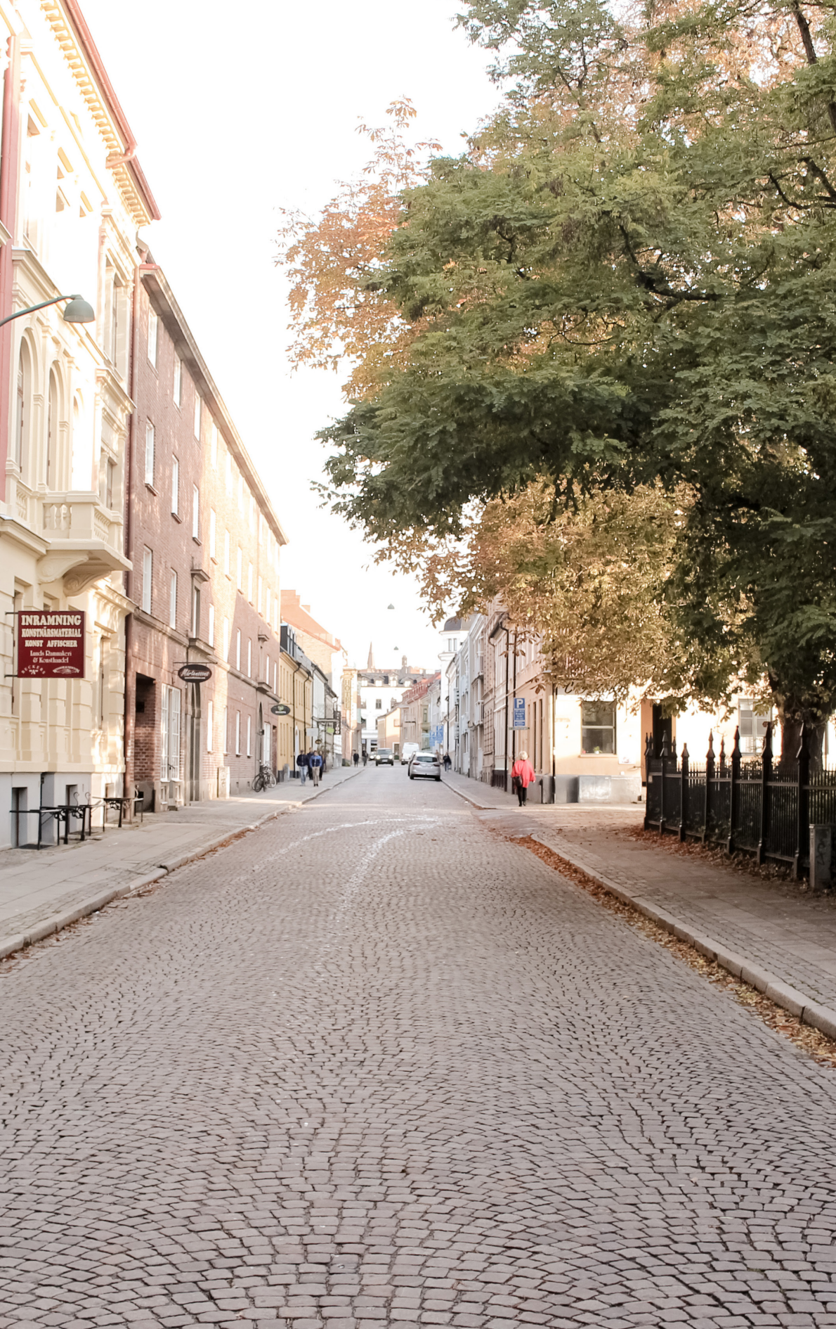
I nära anslutning till Observatoriet och dess park ligger Katedralskolan. Skolans västfasad sträcker sig mot Grönegatan som här fotograferats i sydlig riktning (T.V) och i nordlig riktning (T.H)