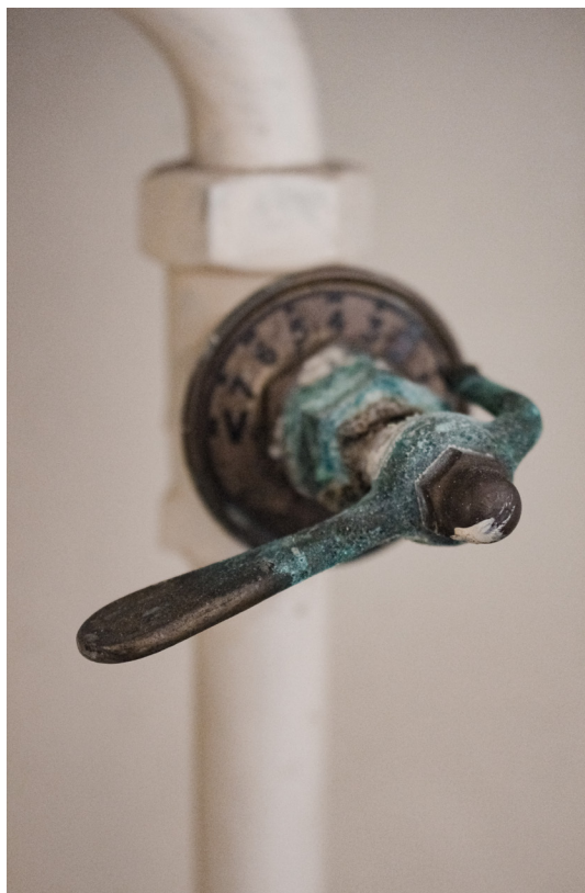
Vred till ett av de äldre radiatorerna (T.V)