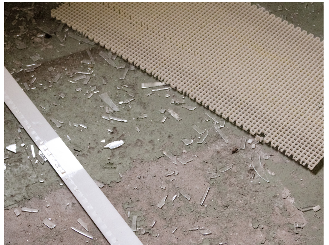
Spår från vandalisering där dagsljuset reflekteras i glassplitter (T.H)