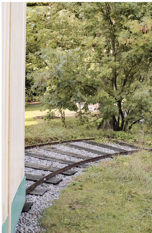
Astrografhuset ligger beläget på en kulle sydväst om Observatoriet. Detta instrumenthus går en kort räls för att optimera observationer