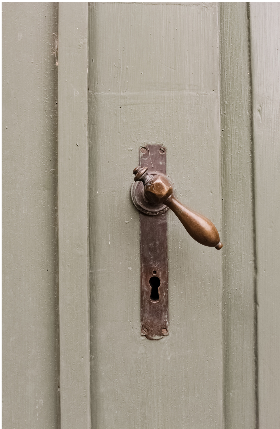
På insidan väntar en mindre polerad yta som stått tom i snart två decennier