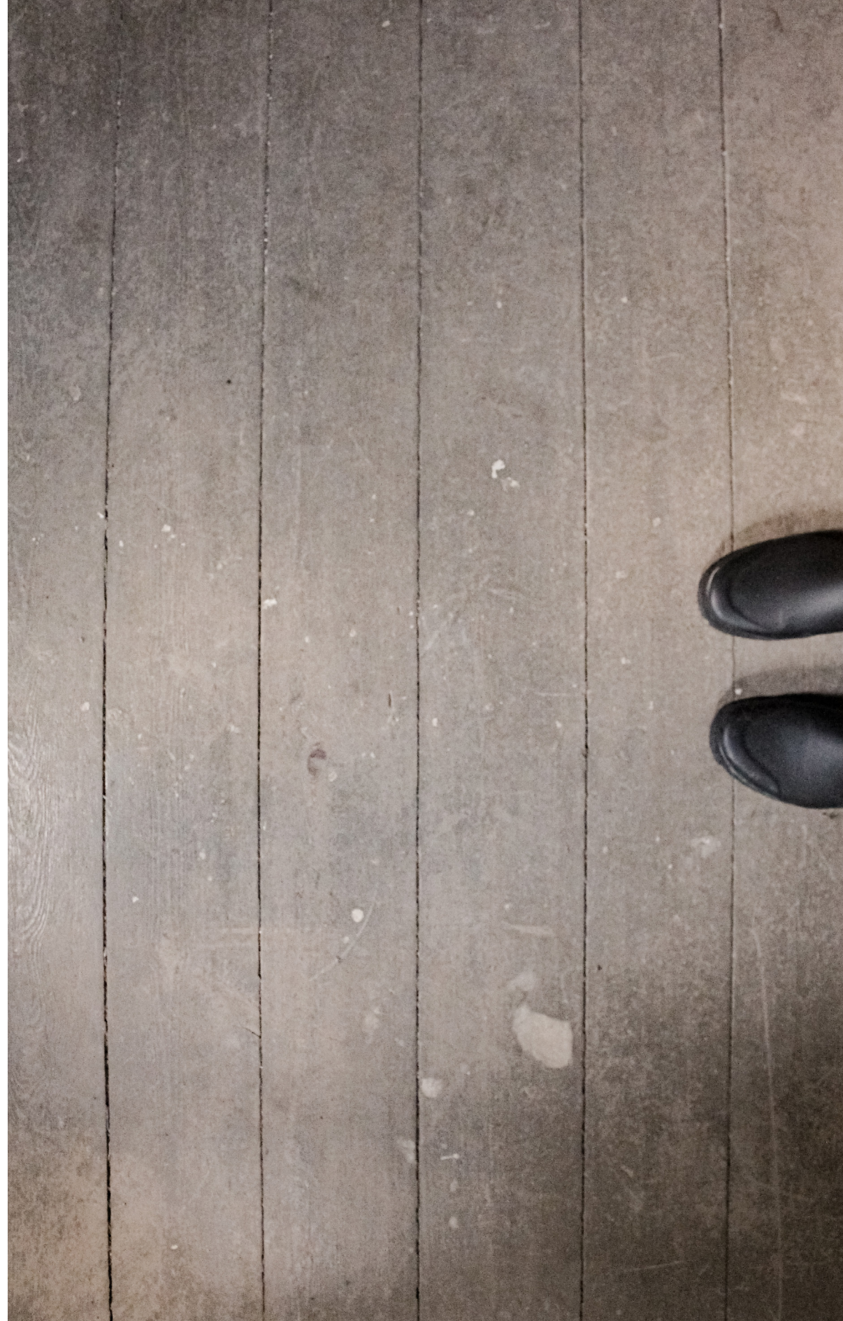
Det forna bibliotekets golv på andra våningen (T.H)