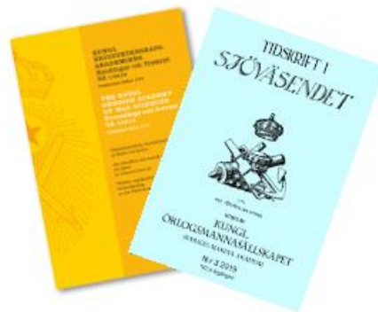
Bild 2: Kungl. Krigsvetenskapsakademiens Handlingar och Tidskrift samt Kungl. Örlogsmannasällskapets Tidskrift i Sjöväsendet .

tidigare eller ny akademiskt godkänd forskning, man har också ett peer-review-förfarande tillsammans med Försvarshögskolan. (KKrVA, Tidskrift )