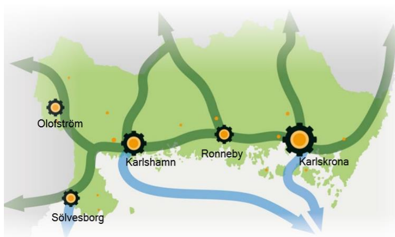
Figur 4.3.1 Översikt över Blekinge samt dess 5 största tätorter (Region Blekinge 2014, egna platsmarkörer)

På frågan om en flerkärnig strategi kan vara lämplig för Blekinge, tar intervjupersonen upp, med tanke på ortstrukturen i regionen med kuststäderna som ett pärlband, cirka tre mil mellan varandra som ses i figur 4.3.1, att regionen kan förstärka den struktur som redan existerar. Något som även bekräftas av Rank-size metodens resultat.