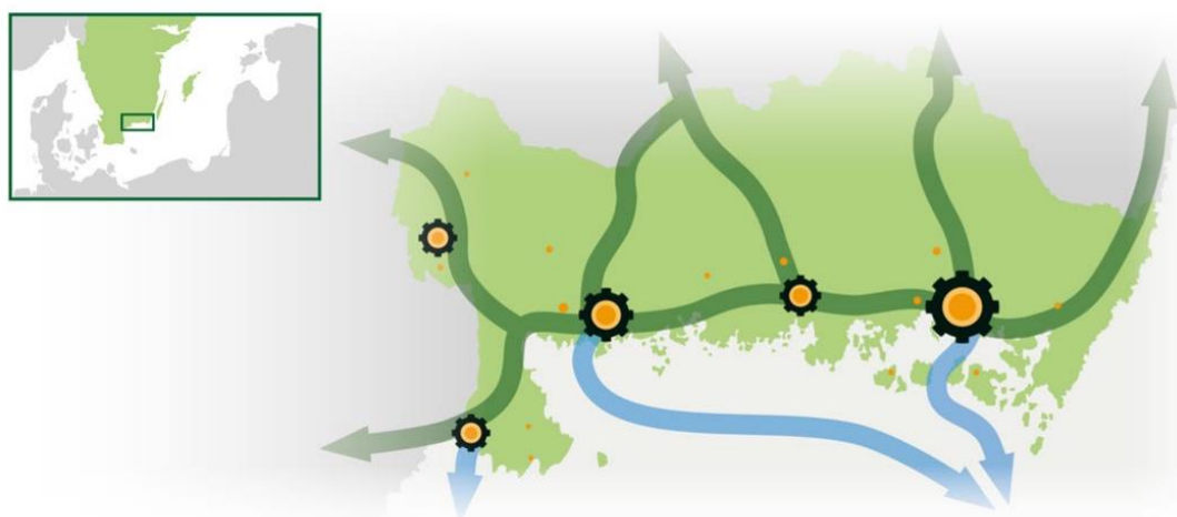
Figur 1.1.1 Illustration av Region Blekinge (Region Blekinge 2014)

Region Blekinge har upplevt en befolkningsökning de senaste åren, samtidigt som det sker en stor utflyttning av framförallt unga vuxna. Regionens befolkningsökning beror helt på inflyttning från utlandet, som regionen dock har svårt att få in på arbetsmarknaden (Region Blekinge 2014). Likt många andra regioner i Sverige har även Blekinge ett demografiskt problem med en ökande andel äldre vars pension och leverne ska bekostas av allt färre. Med en mer polycentrisk utveckling genom förbättrade transporter finns möjligheter att vidga arbetsmarknaden och förbättra matchningen mellan arbetstagare och arbetsgivare vilket kan underlätta försörjningen av äldre i regionen.