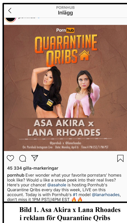
Bild 1. Asa Akira x Lana Rhoades i reklam för Quarantine Qribs

Bilden är uppbyggd på följande vis: Kvinnorna är placerade bredvid varandra i samma skala i mitten av bilden. Centralt i överkanten av bilden är Pornhubs logga. Under loggan, precis ovanför kvinnornas huvud står titeln på