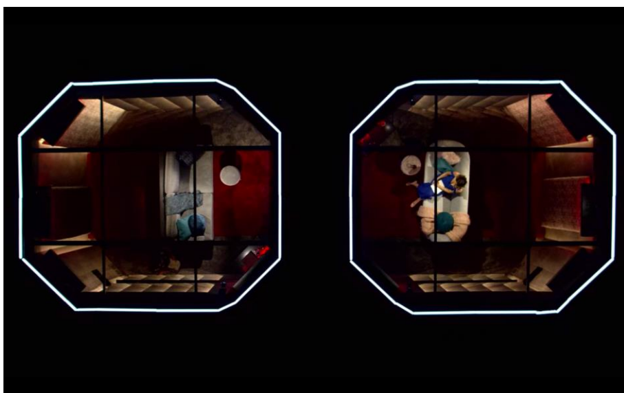
Bilaga 3: Bild på poddar