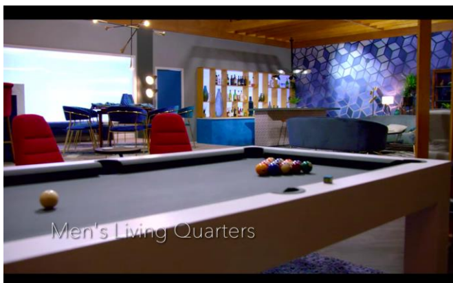
Männens gemensamma rum